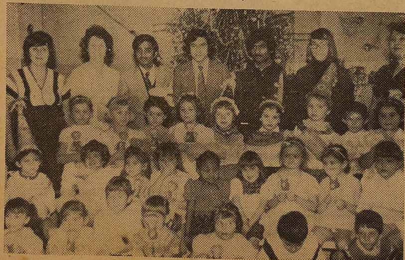
«ЗА НАУКОВІ КАДРИ»