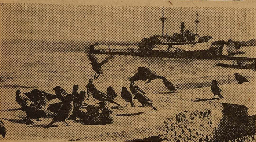
Погрітись на сонці.