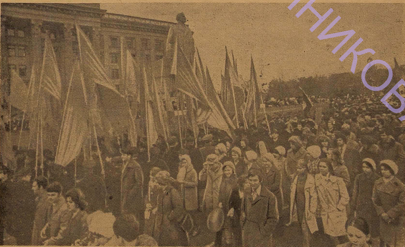
Колектив університету на святковій демонстрації.

Зі святом поздоровили нас і колективи багатьох інших вузів країни, в тому числі — одеських.