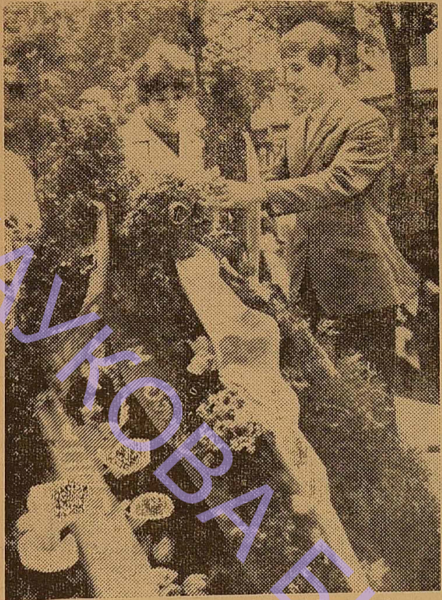
(Закінчення. Початок на 1-й стор.)

Він відзначив, що велика Перемога радянського народу — це одноразова і Перемога трудящих, всіх прогресивних людей земної кулі, Перемога комуністів всієї планети.