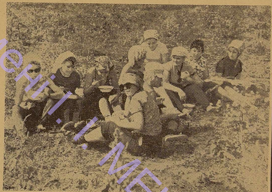
Фото К. Рогожкіна, С. Єфімова та викладача К. Гречаного.