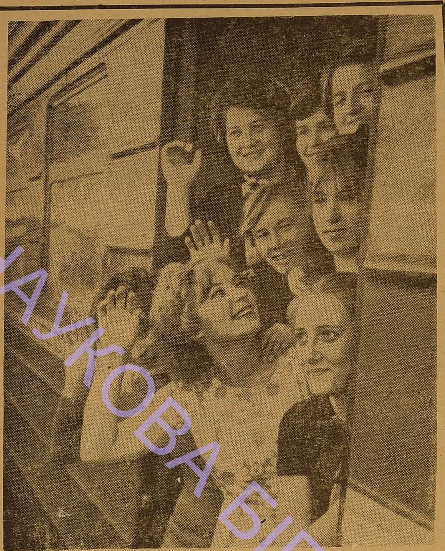
ДО ПОБАЧЕННЯ, ОДЕСА