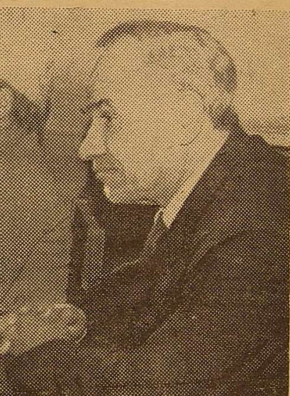
Професор Ф. С. ЗАМБРИБОРЩ.