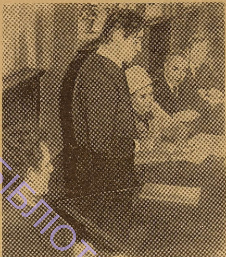
Иде зустріч за «круглим столом».

Члени семінару мають бути активними лекторами-пропагандистами марксистсько-ленінського вчення. Ця вимога підвищує активність і рівень занять.