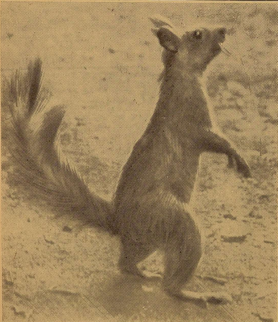
«Белка песенки поет да орешки все грызет».

С. УШАРОВИЧ, голова ради автодружини Центрального району.