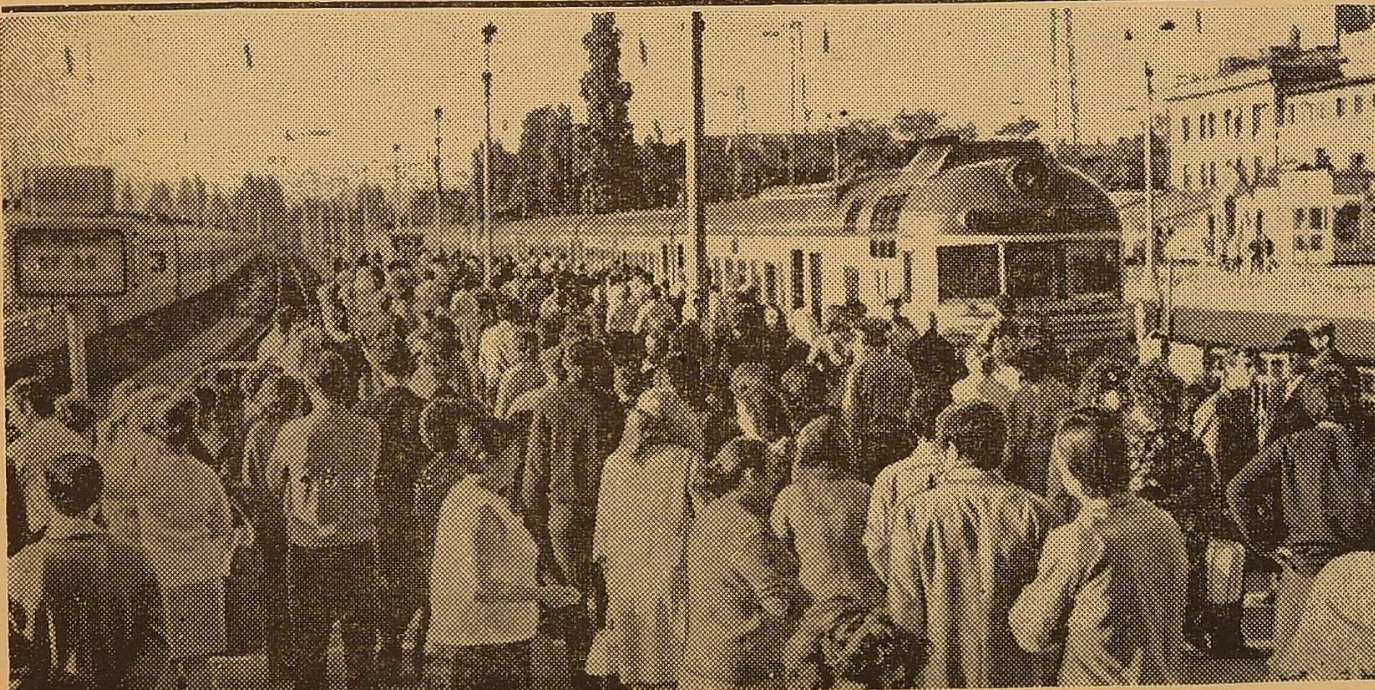
Від'їзд студентів на сільгоспроботи.

Іванівського району, де трудяться студенти-географи четвертого курсу, у пам'яті зринали відомі слова Макенма