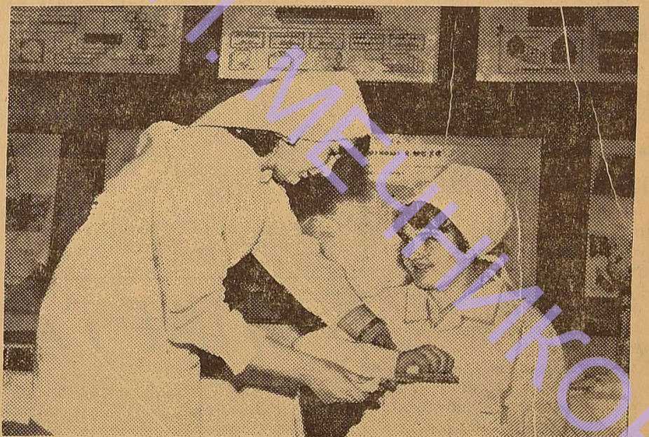
На практичних заняттях.

що ви теж належите до представників найгуманнішої професії — лікарів, пам'ятайте, що ви — сестри милосердя», — сказав С. Я. Шпак.