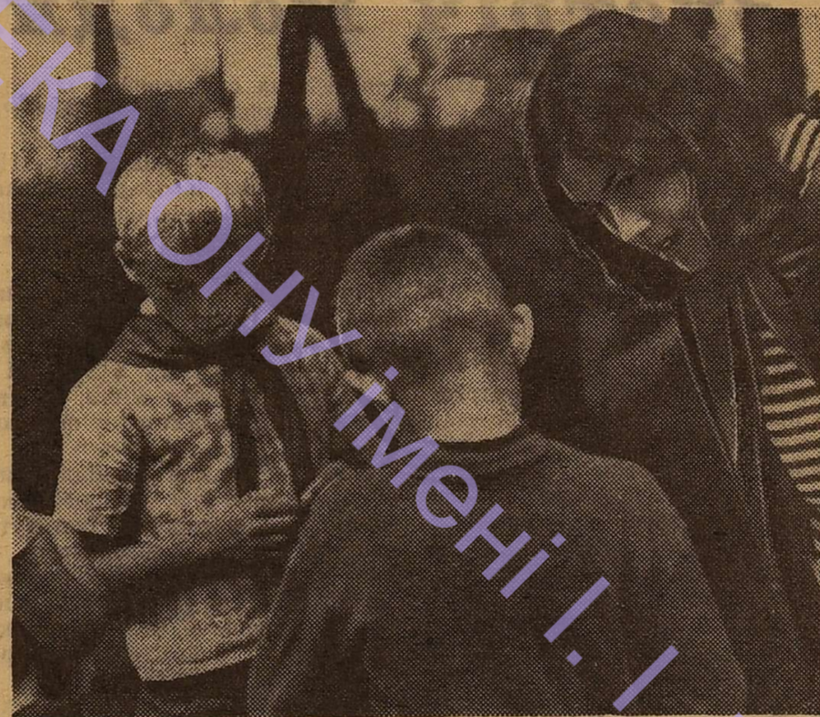
Яких тільки питань не виникає в піонерській роботі. Серед них — багато дуже складних. Одне з таких питань вирішує студентка зі своїми вихованцями під час піонерської практики у таборі «Республіка юних романтиків».

С. БУДЗАР, студент четвертого курсу історичного факультету.