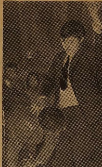
Програма Дня фізфаку була цікавою і різноманітною. Але особливо сподобався всім КВВ. На фото — фрагмент змагань; зал уважно стежить за виступами.