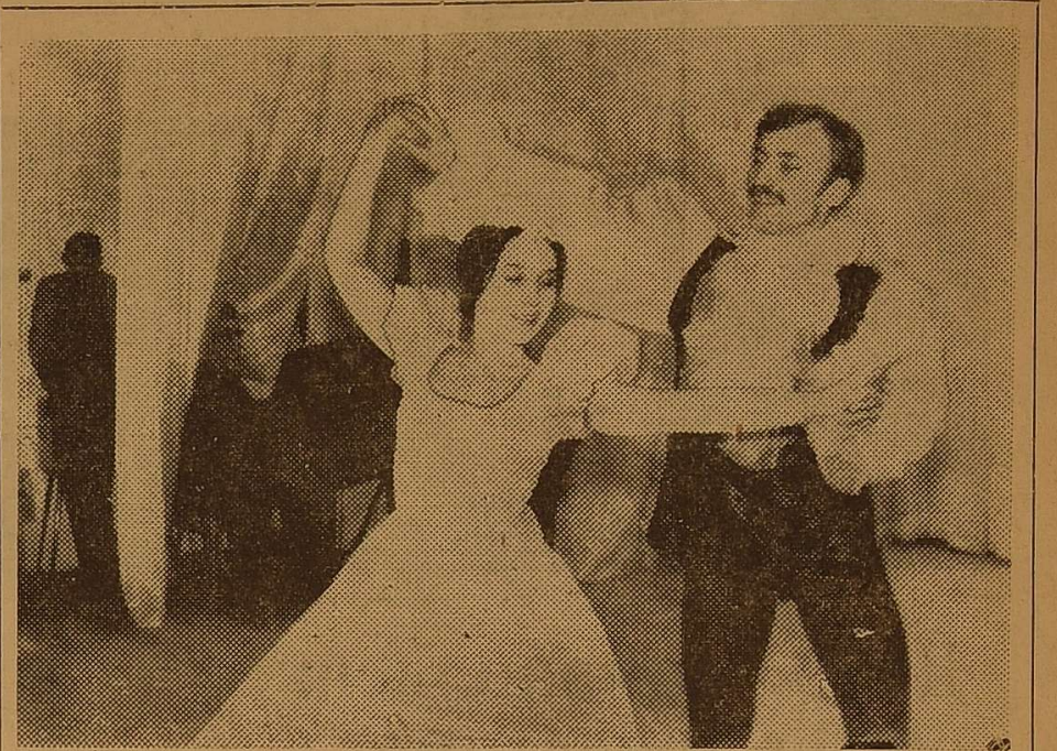
Чарівна мелодія вальсу Й. Штрауса... Вона звучала на концерті філологів, і глядачам сподобався танок.

Філологи вдало використовували в своїй програмі всі концертні жанри, починаючи від художнього читання і закінчуючи танцями. Причому, всі номери виконувались на високому рівні. Зачаровано слухав зал, як Тетяна Яким-