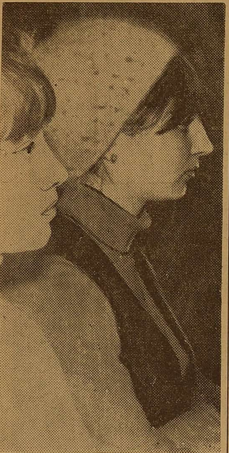
«Дружба — всего дороже, Дружба — это знамя молодёжи...» — лунає «Гімн дружби».