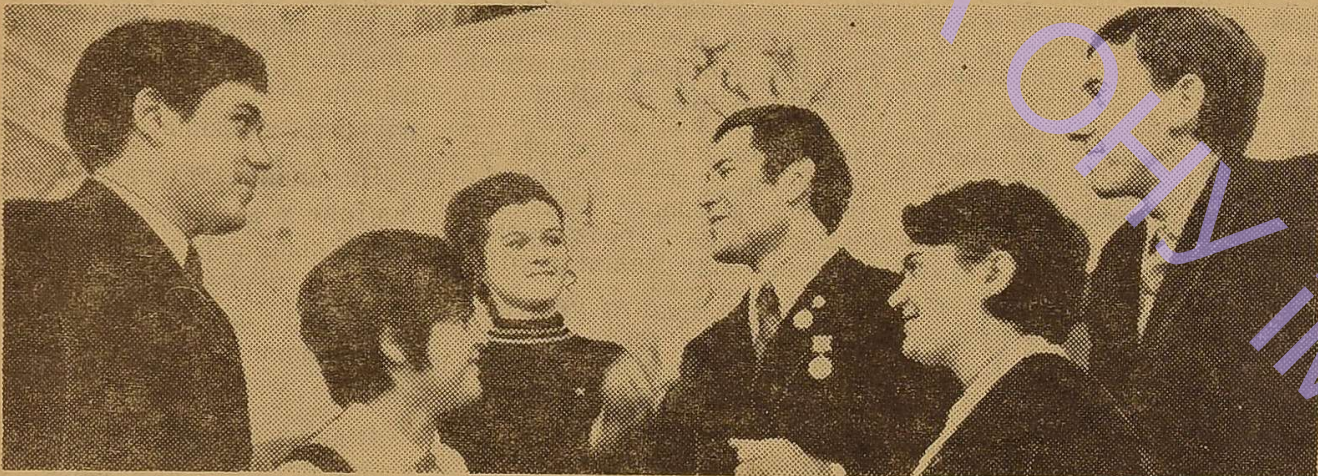
Учасники обласних зборів студентів.