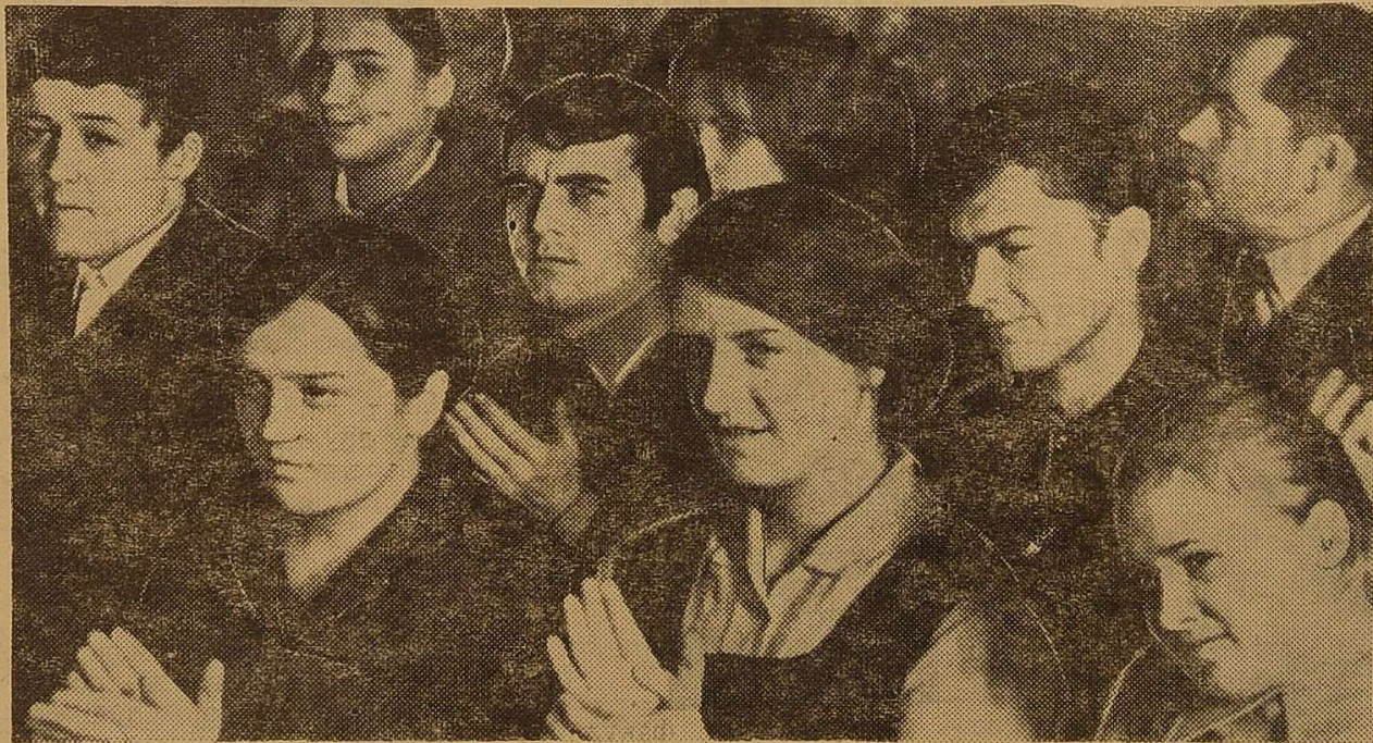
На обласних зборах студентів.

Дорога наша юнь! Багрянolistий жовтень року 71-го, року XXIV з'їзду партії нашої, позначений величною подією — Всесоюзним