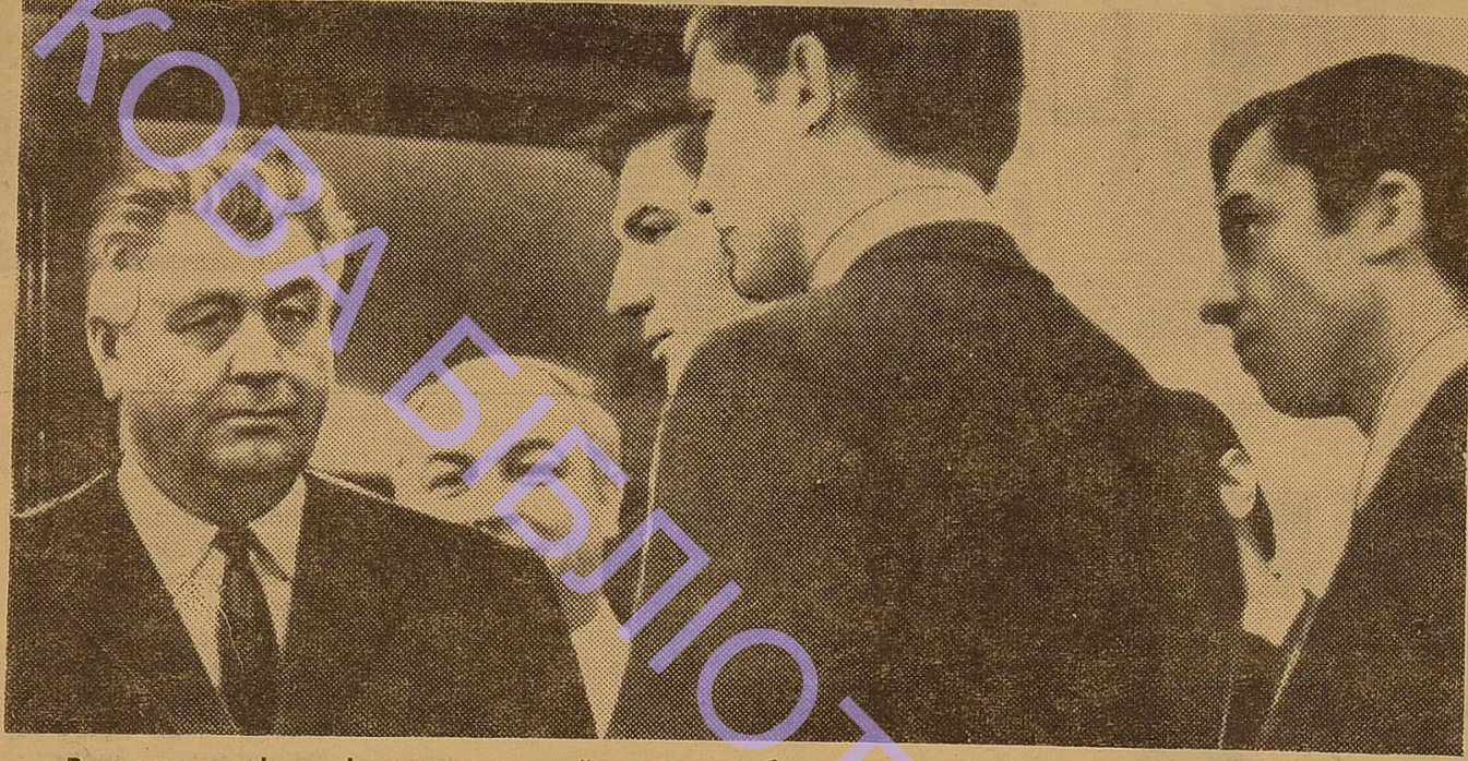
В перервах між засіданнями перший секретар обкому партії П. П. Козир розмовляє з студентами.

На цих героїчних прикладах, яскравих традиціях ми повинні виховувати в кожного студента бажання берегти, мов зіницю ока, студентську честь, пишати героїчним минулим і сучасним свого вузу, рідного міста-