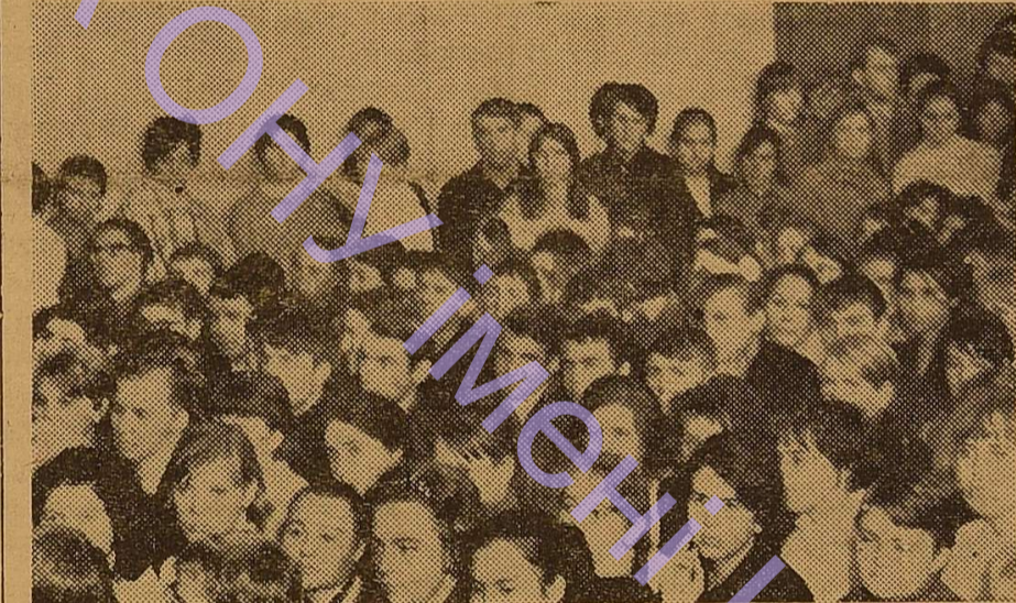
Уважно слухає зал виступ ректора університету професора О. В. Богатського .

Нинішній рік — рік підготовки до XXIV з'їзду КПРС. Немає сумніву, що першокурсники, як і ваші старші товариші по навчанню,