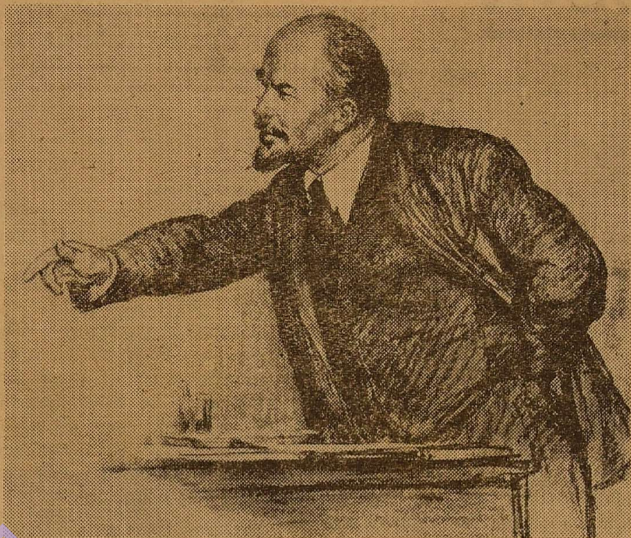
Виступ В. І. Леніна на III з'їзді комсомолу.

В тому і виявилась геніальна прозорливість Володимира Ілліча Леніна, що він думав про майбутнє, бачив в цих молодих людях в постолах і в обмотках, в зіпунях і солдатських шинелях те покоління, якому належало будувати і побудувати комуністичне суспільство. «Чому вчитися і як вчитися?». І вождь просто і дохідливо пояснив комсомольцям, що «виховання і освіта нових поколінь, які створюватимуть комуністичне суспільство, не можуть бути старими». І тут В. І. Ленін повторює свою відому тезу про використання комуністами всього корисного і необхідного, «тієї суми знань, організації і установ, при тому