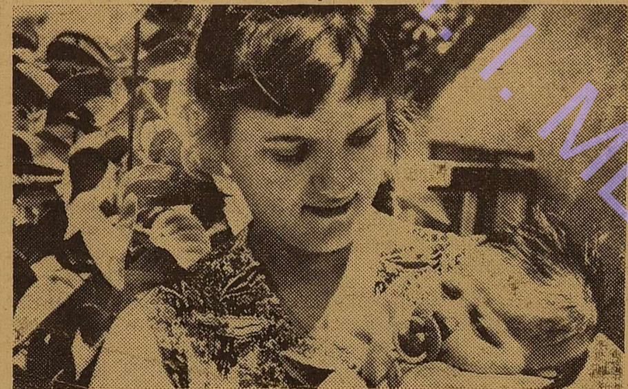
Хай завжди буде мама.