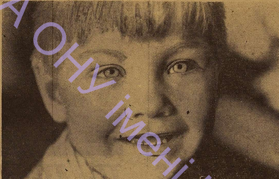
Хай завжди буде сонце.

Одинадцять років тому Генеральна Асамблея ООН прийняла декларацію про права дітей. Однак принципи її в капіталістичних країнах залишаються на папері. Капіталізм і колоніалізм винуваті в тому, що понад половина дітей нашої планети страждають від голоду і хвороб, вмирають, ледь появившись на світ. Особливо, важке становище дітей в колоніальних і залежних країнах Азії, Африки і Латинської Америки. Імпералізм калічить дітей і фізично і морально. У всіх країнах земної кулі росте і ширшає рух прибічників миру. Виступаючи за мир, мільйони людей доброї волі борються за щастя своїх дітей, за світле майбутнє всього людства.