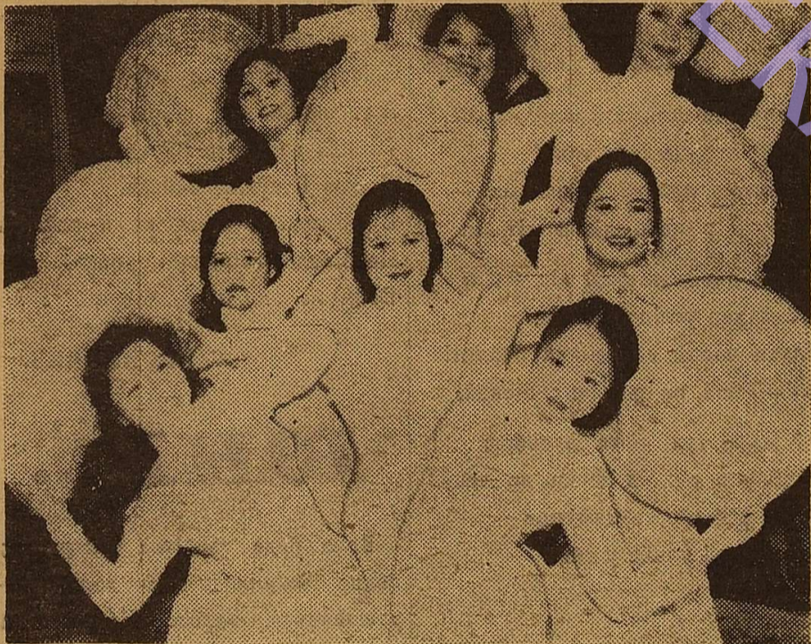
В'єтнамські студенти, які навчаються у нашому вузі, виконують національний танок Муа Нон.

ВСТАНОВИТИ ЧИСЕЛЬНІСТЬ БУДІВЕЛЬНИХ ЗАГОНІВ КІЛЬКІСТЮ 150 ЧОЛОВІК.