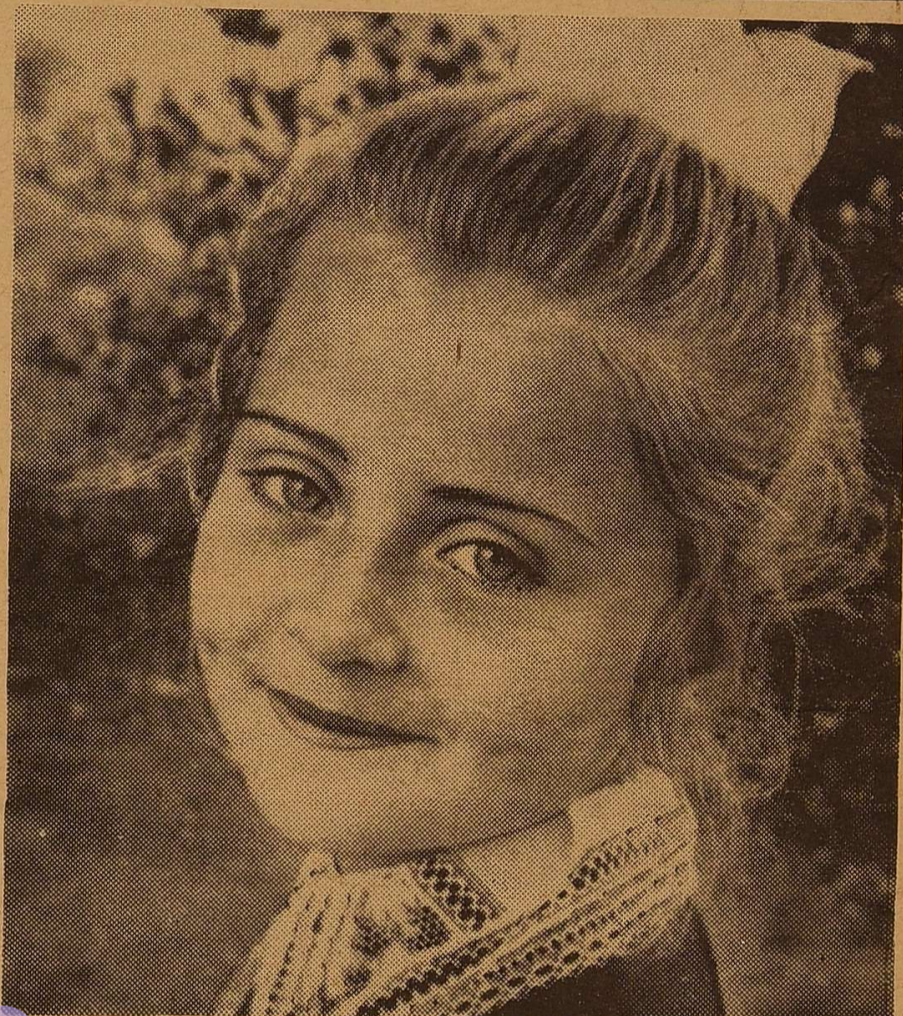
НАША ЗМІНА.