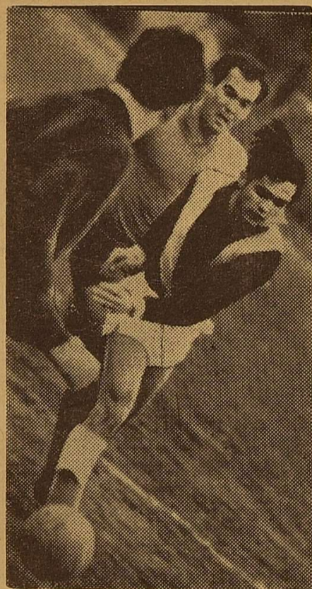
Гострий момент.

В. ГОЛОВЧАНСЬКИЙ, С. МОЛЧАНОВ, студенти факультету романо-германської філології.