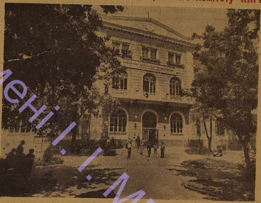
ГОЛОВНИЙ КОРПУС УНІВЕРСИТЕТУ.

М. СТРЕЛЬБИЦЬКИЙ, студент філологічного факультету.