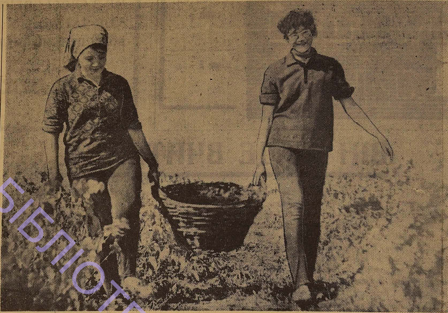
Відмінно працювали ці студентки-другокурсниці хімічного факультету. Зараз вони почали навчання і так само старанно оволодівають знаннями.

В. КОЗАК, студент першого курсу філологічного факультету.