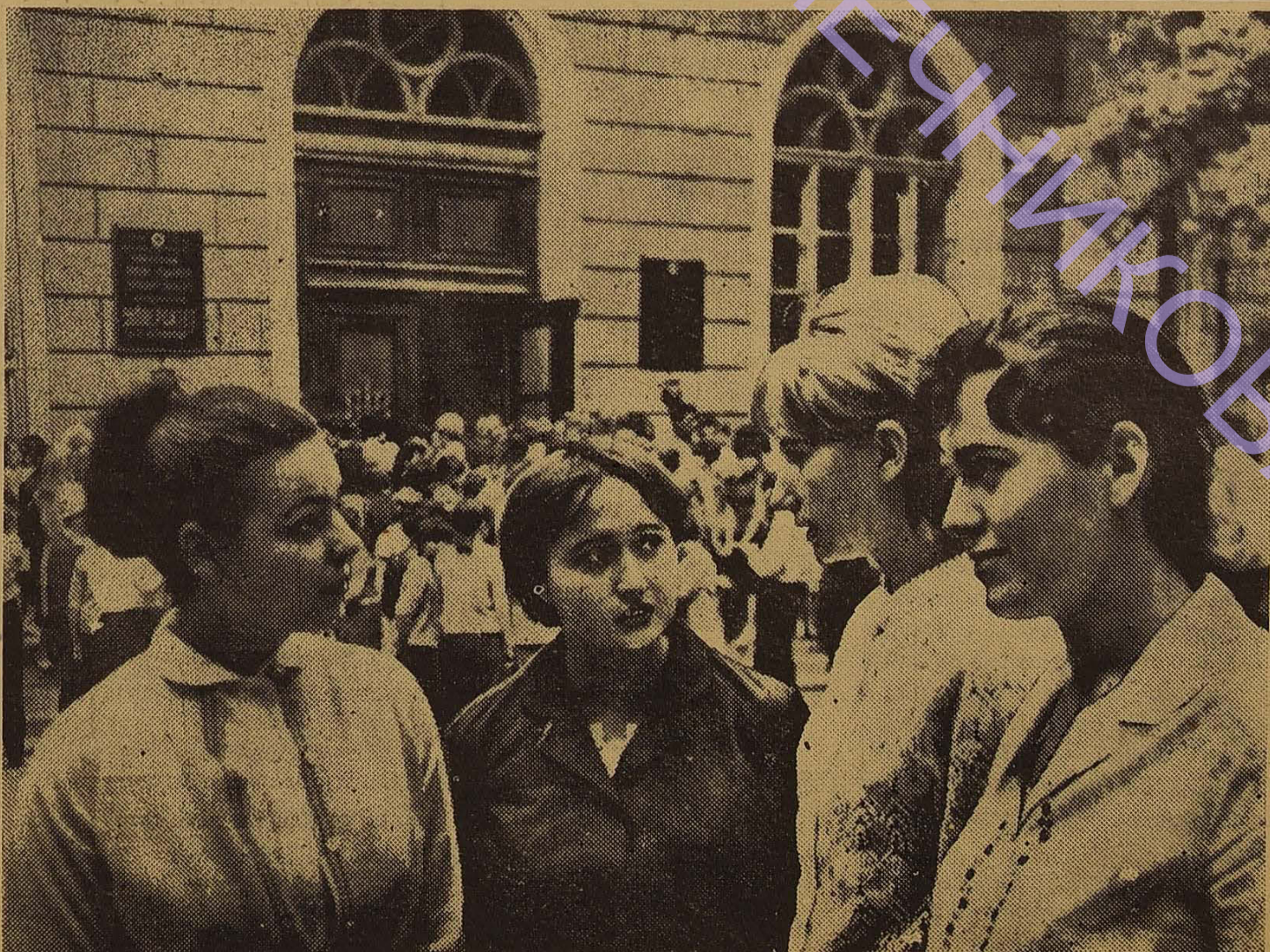
Юнаки і дівчата прямують в актовий зал на свої перші університетські збори. На передньому плані — першокурсники російського відділення філологічного факультету.