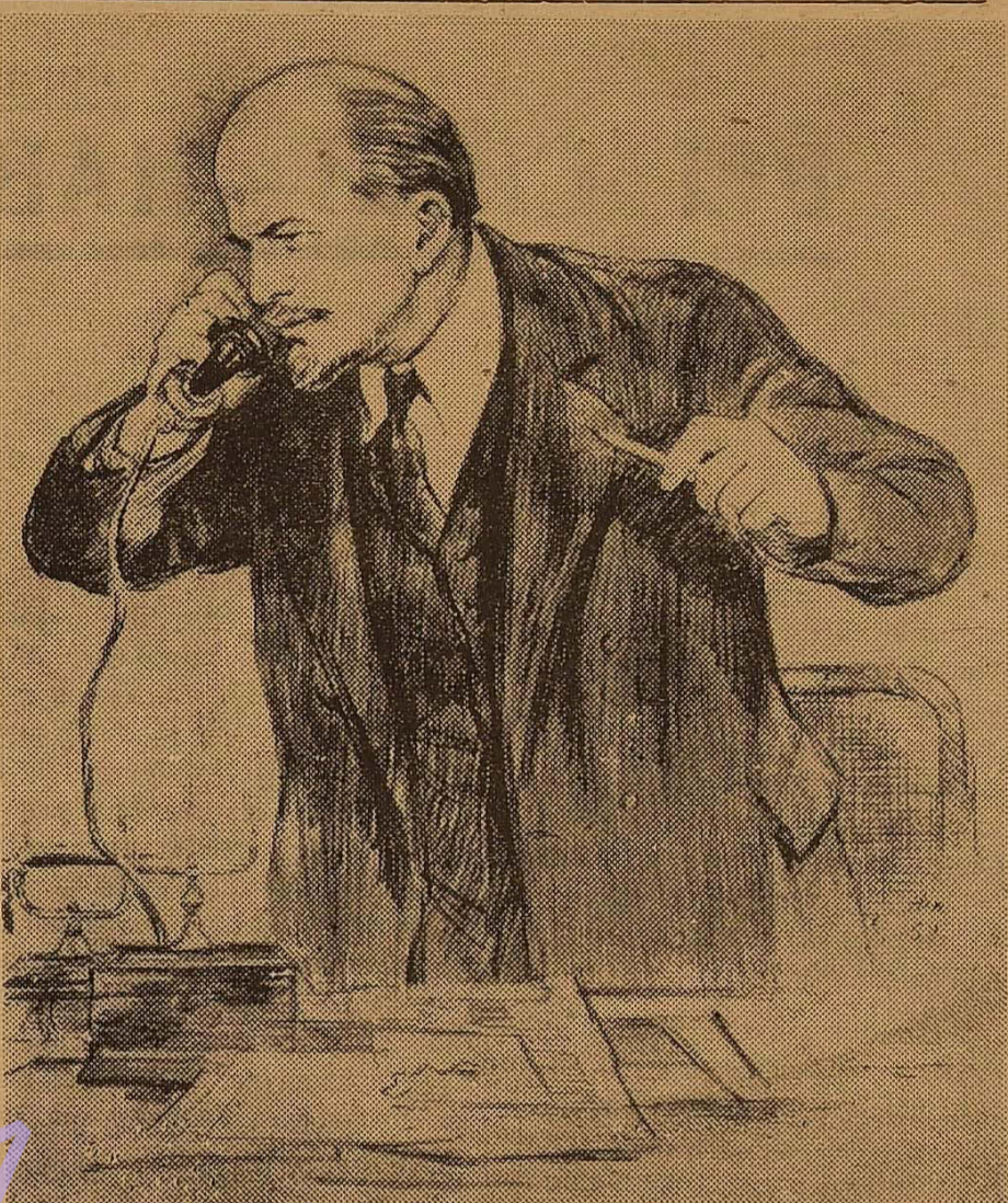
НЕ ВИТРАЧАТИ ХВИЛИНИ.