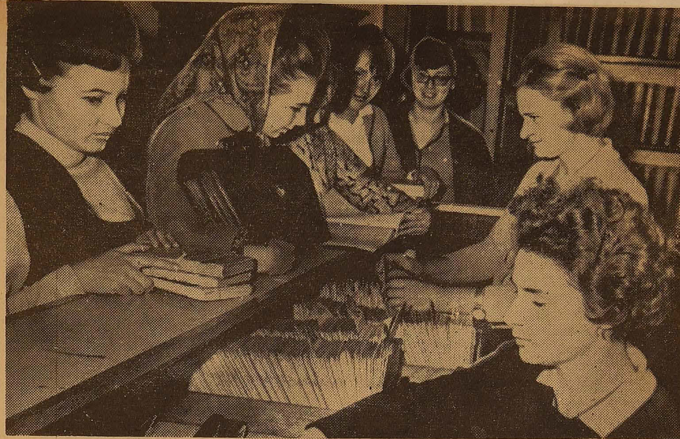
Для наших студентів настали напружені навчальні будні. В бібліотеках, читальних залах стало людно. Студенти одержують потрібну їм літературу, готуються до семінарських та практичних занять.

М. М. ГРУЗИНЕНКО, завуч Балтської СШ № 6.