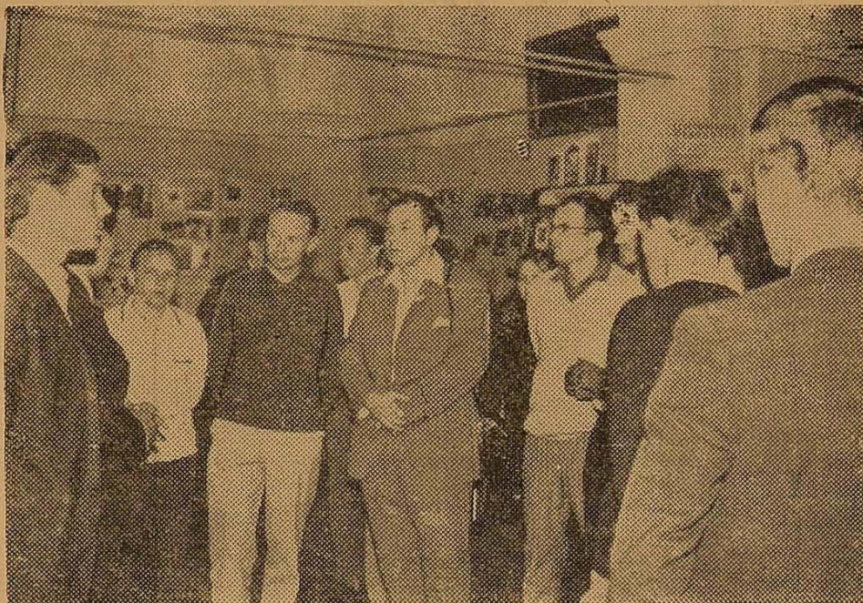
НА ФОТО: гості з Чехословаччини в музеї історії ОДУ.