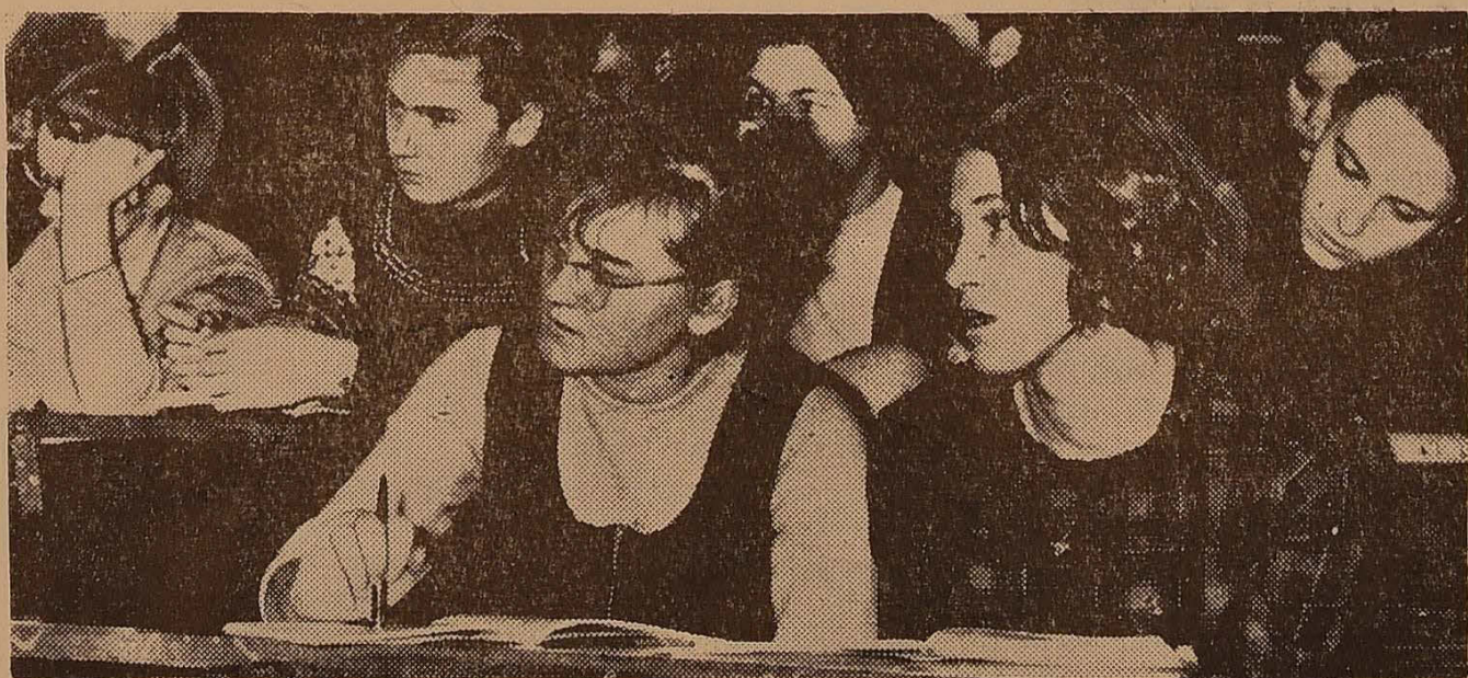
Позаду зимова сесія, канікули. Ідуть навчальні будні — лекції, практичні і семінарські заняття, колоквіуми. НА ЗНІМКУ: студенти першого курсу фізичного факультету на лекції з аналітичної геометрії.

ВЧЕНА рада університету прийняла рішення, в якому визначила заходи, спрямовані на підвищення успішності студентів, поліпшення справи підготовки ідейно-загартованих, висококваліфікованих спеціалістів.