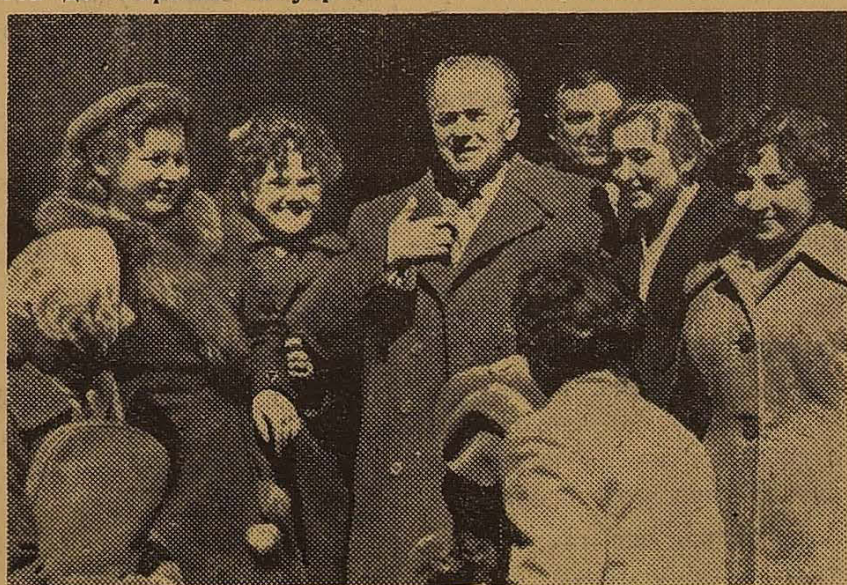
П. Г. ТИЧИНА В КОЛІ СТУДЕНТІВ — УЧАСНИКІВ ТИЧИНІВСЬКОЇ КОНФЕРЕНЦІЇ.