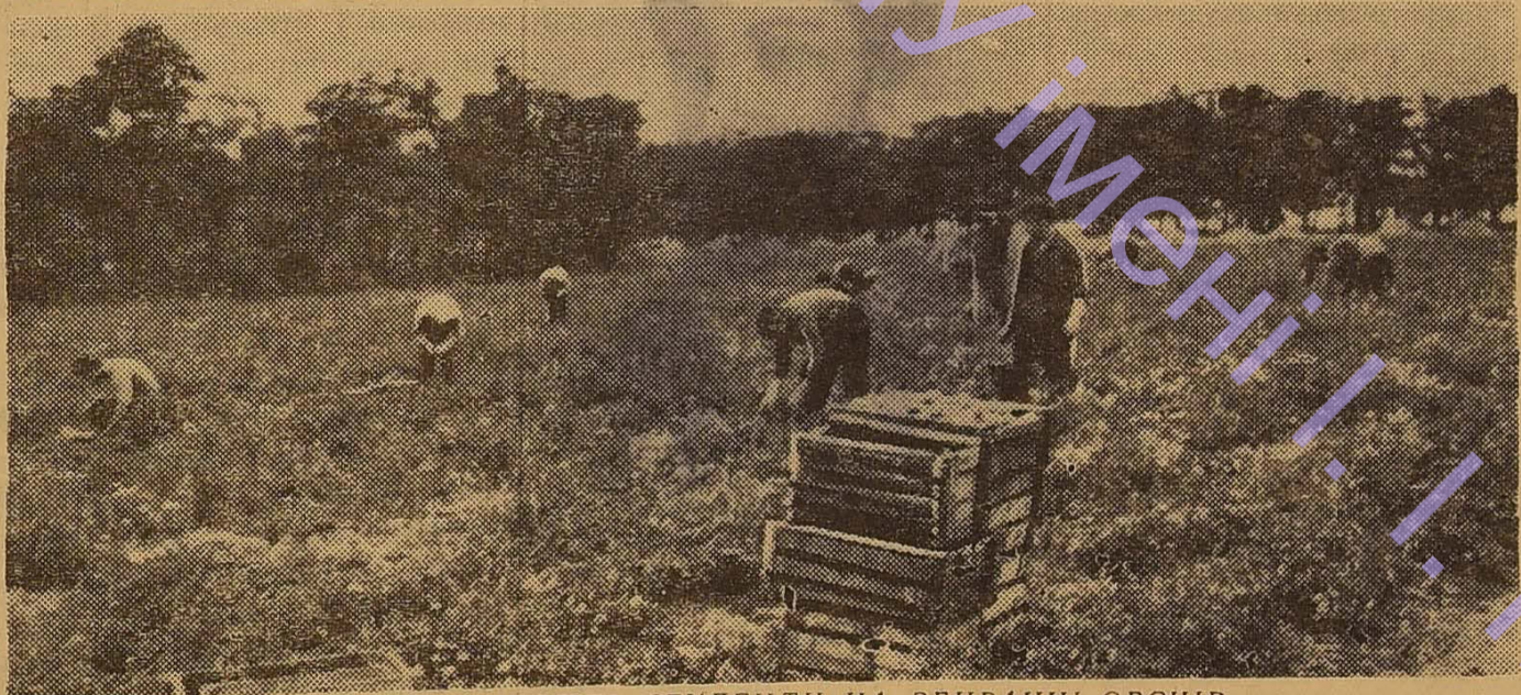
ДОБРЕ ПРАЦЮЮТЬ СТУДЕНТИ НА ЗБИРАННІ ОВОЧІВ

мали. І придумали. Хтось з наших дівчат запропонував перейти на самообслуговування. Це значить, що ми стали самостійно готувати собі їжу, замовляти продукти.