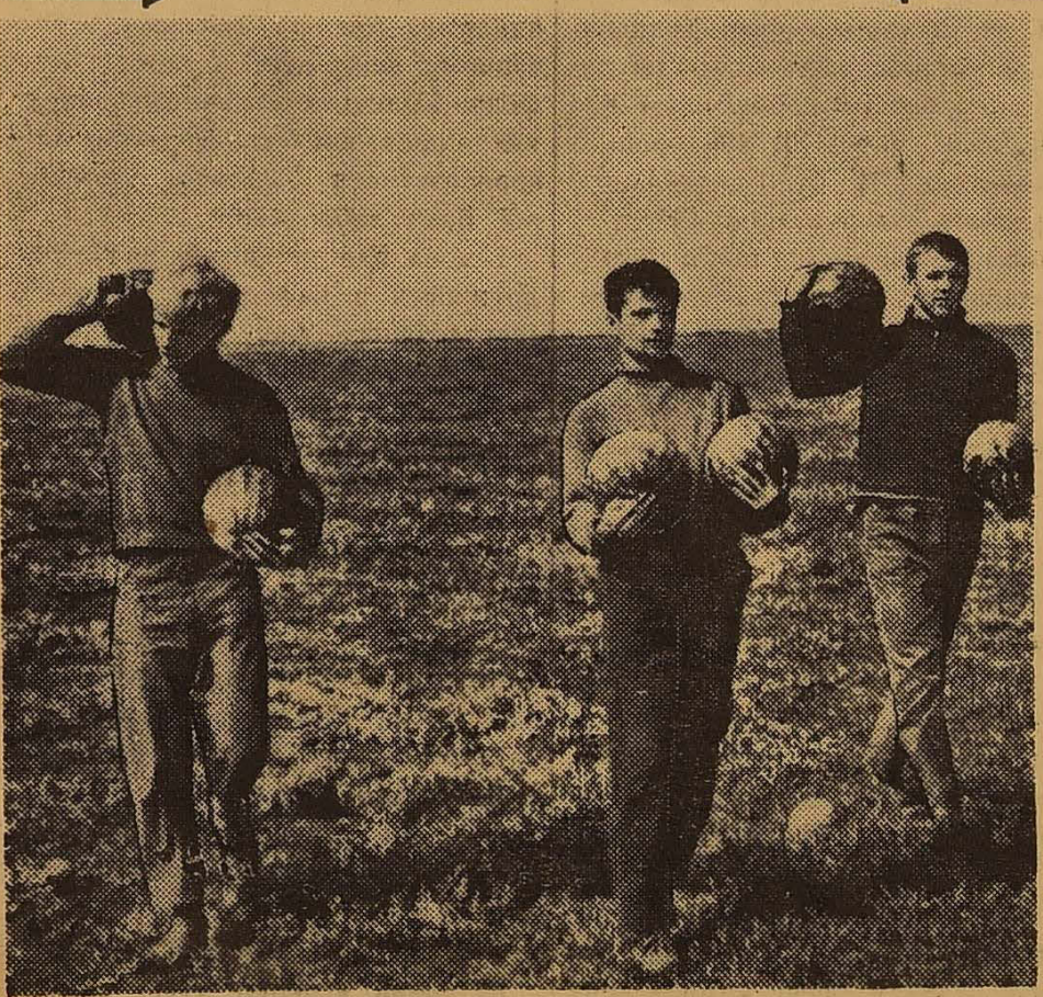
ХОРОШІ ВРОДИЛИ ЦЬОГО РОКУ КАВУНИ!

Зробили щось схоже на виробничу нараду. Стали вияснити причини. Звалили все на втому, та і в сніданку калорій, так потрібних для виконання норми, явно не вистачало. Обідом теж залишились незадоволені. Ввечері пісні не співали, вірші не читали. Ду-