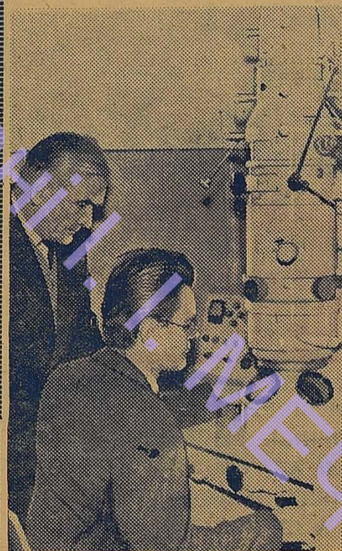
НА ЗНІМКУ: за роботою на електронному мікроскопі.

ФІЗИЧНИЙ факультет — один з найкрупніших в університеті. На ньому вчиться понад 650 студентів денного й вечірнього відділень. Факультет готує висококваліфікованих спеціалістів з фізики та астрономії для роботи у вищих і середніх учбових закладах, в науково-дослідних лабораторіях, заводських лабораторіях і т. д.