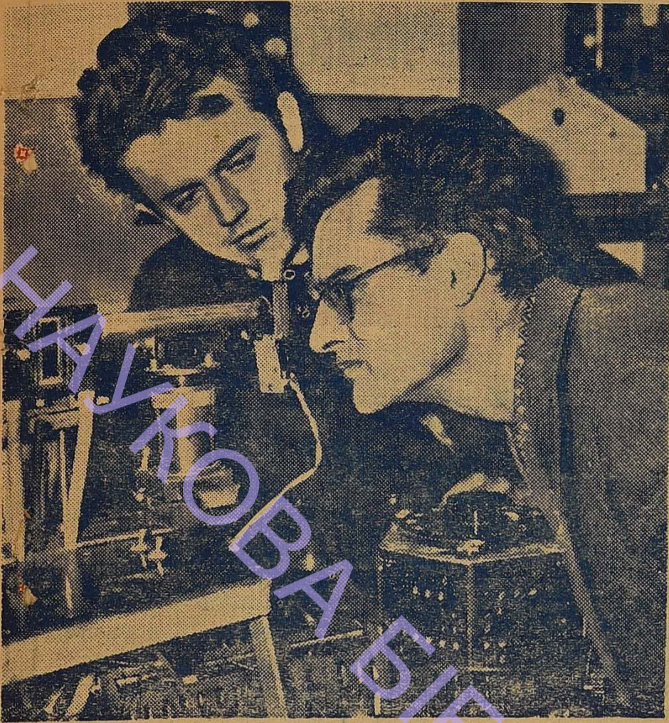
ЗА ПРОВЕДЕННЯМ ДОСЛІДУ.