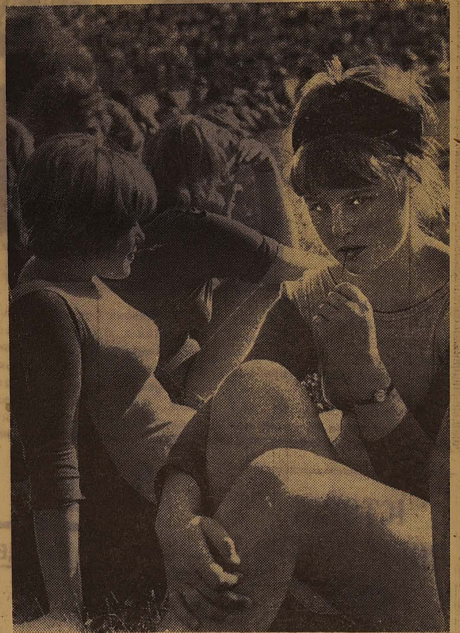
НА СТАДИОНИ. ПОДРУГИ.

В. РУСАКОВ, студент-вечерник биологического факультета.