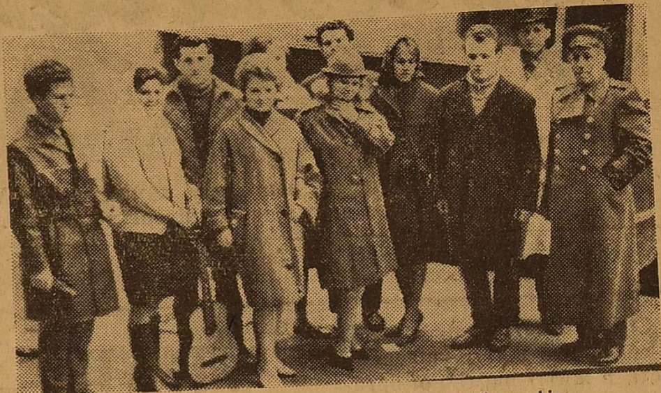
Культбригада істориків вирушає до своїх шефів.