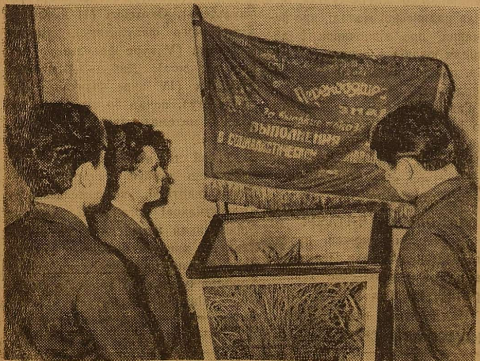
Делегати розглядають цілісний сніп.

Конференція прийняла розгорнуте рішення і обрала новий склад комітету комсомолу та делегатів на комсомольську конференцію Центрального району м. Одеси.