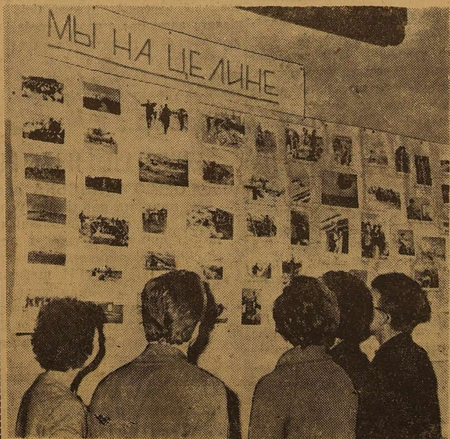
Делегати конференції розглядають фотомонтаж.

Тематика занять різноманітна. Форма їх — лекції, бесіди, дискусії. Відвідайте Клуб етики та естетики. Він чекає вас. Адреса: вулиця Петра Великого, 2, головний корпус, аудиторія, 52.