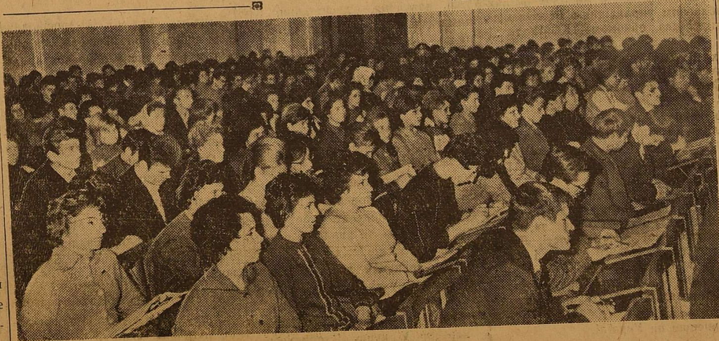
Уважно слухають доповідь делегати.

Комсомольці помічають ці недоліки, в своїх виступах вони спрямували вогонь критики саме на них. Це була відверта розмова, це було по-справжньому гостре обговорення питань комсомольського життя.