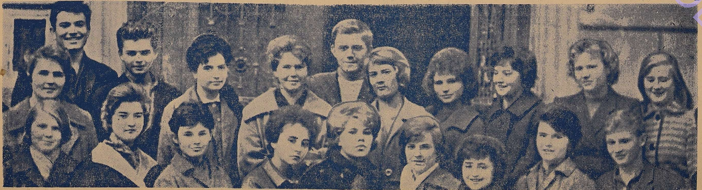
Ось вони, першокурсники, які йдуть сьогодні в університетській колоні.