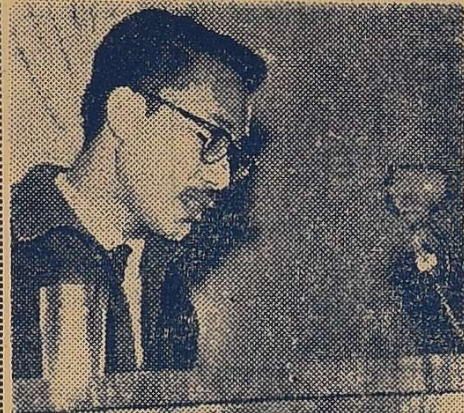
28 Жовтня. День Клятви індонезійської молоді. В цей день студентська молодь вузів міста — представники багатьох національностей і держав —