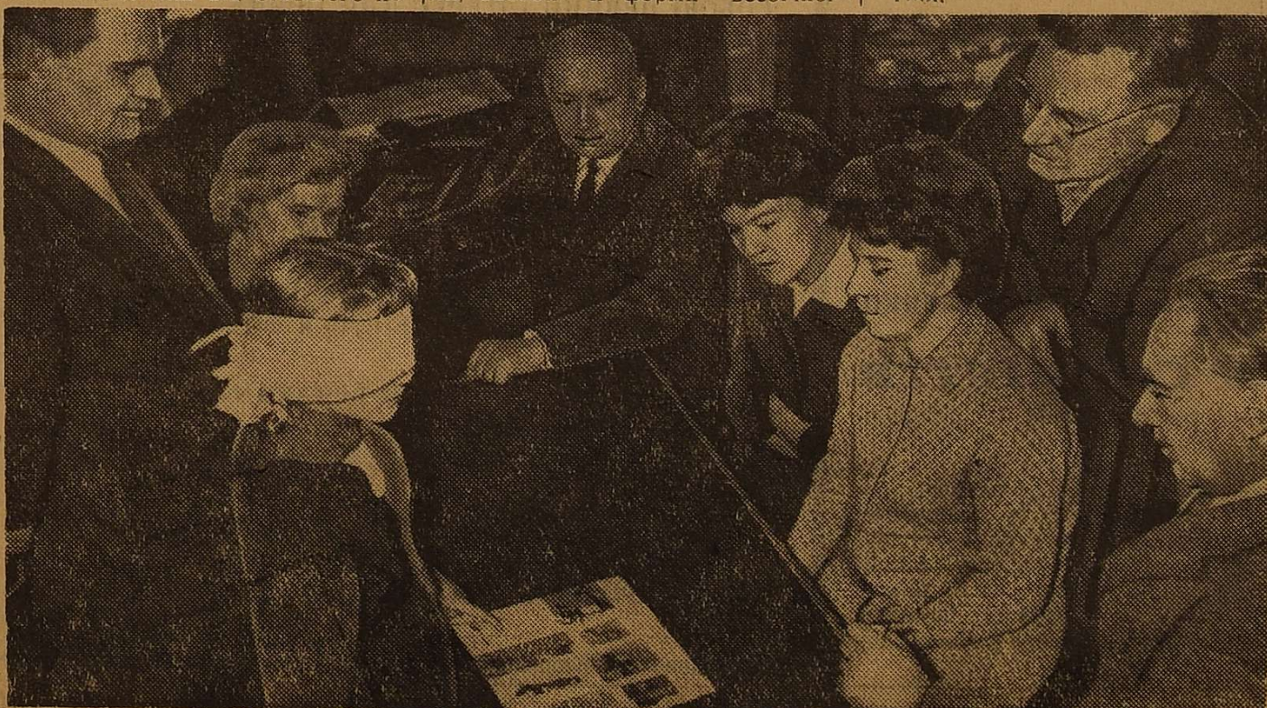
Члени кафедри педагогіки ОДУ під час демонстрації досліду.