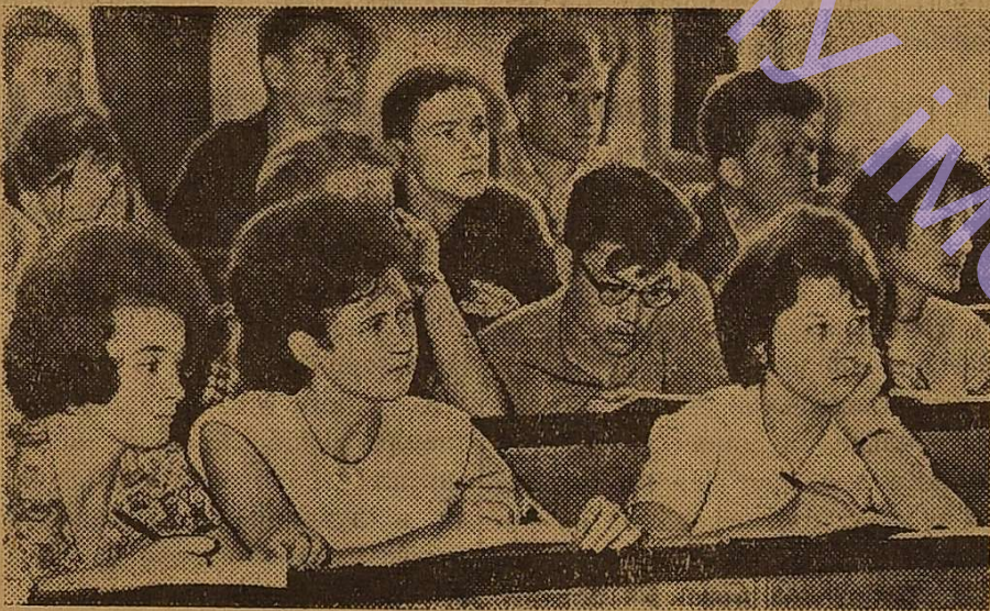
Иде лекція. Уважно слухають студенти.

Доповіді були вислухані з великим інтересом і викликали жвавий обмін думками.