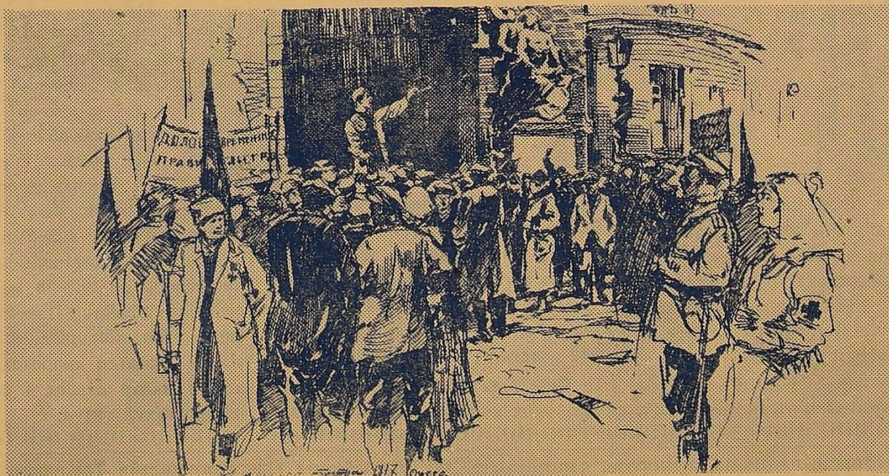
ЖОВТНЕВІ ДНІ В ОДЕСІ.