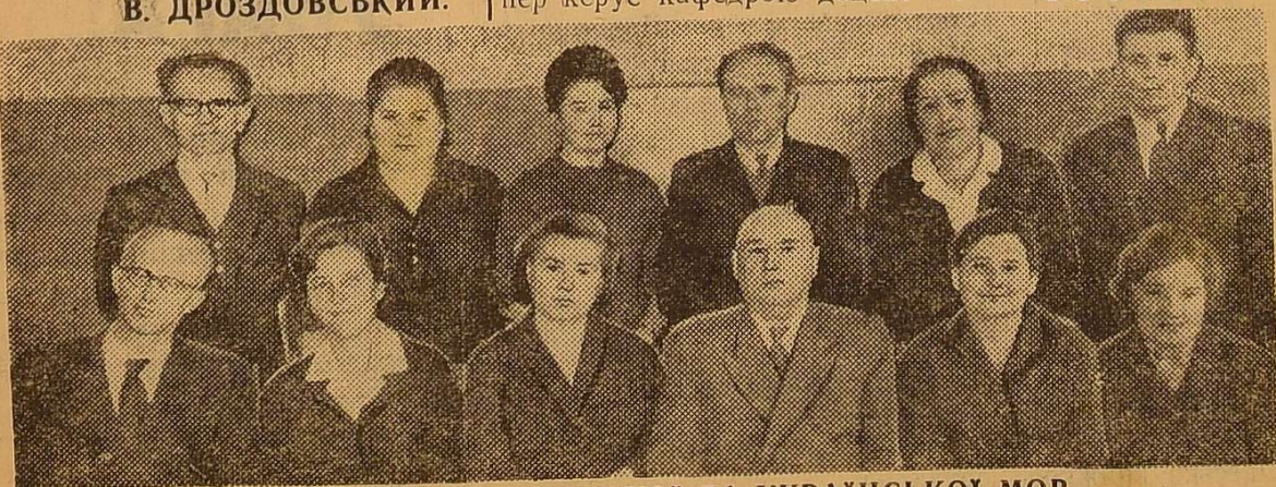
ЧЛЕНИ КАФЕДР РОСІЙСЬКОЇ ТА УКРАЇНСЬКОЇ МОВ.