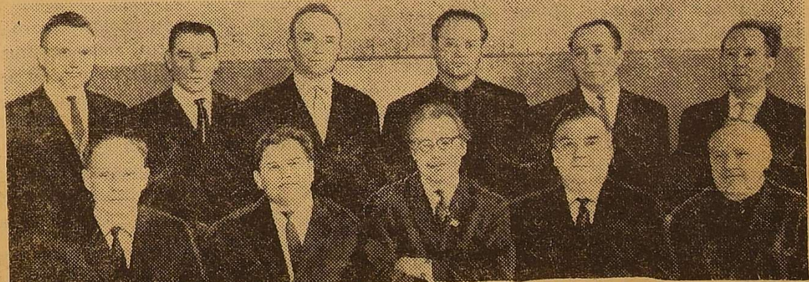
ЧЛЕНИ КАФЕДРИ УКРАЇНСЬКОЇ ЛІТЕРАТУРИ.