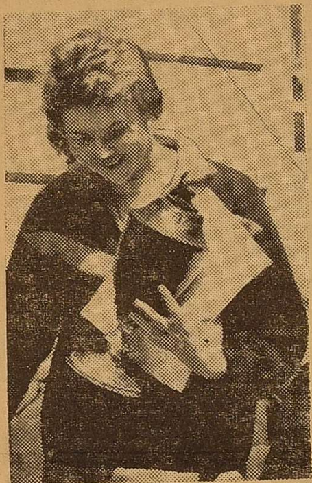
І переможці ніяковіють.