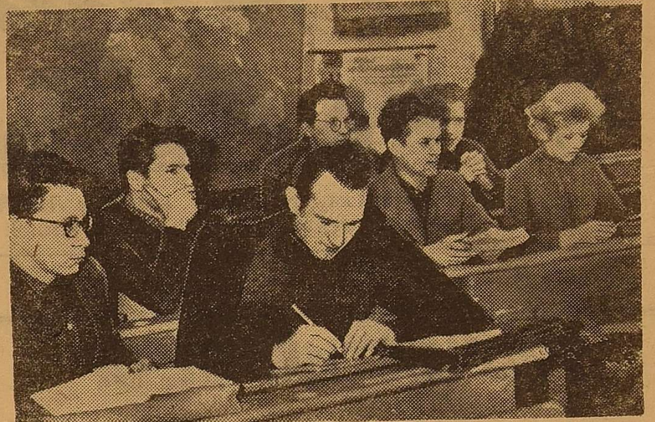
І так, перший етап педагогічної практики закінчився. Історики-четвертокурсники уважно слухають поради і зауваження своїх керівників.

Доцент В. РУЖЕЙНИКОВ, завідуючий кафедрою педагогіки.