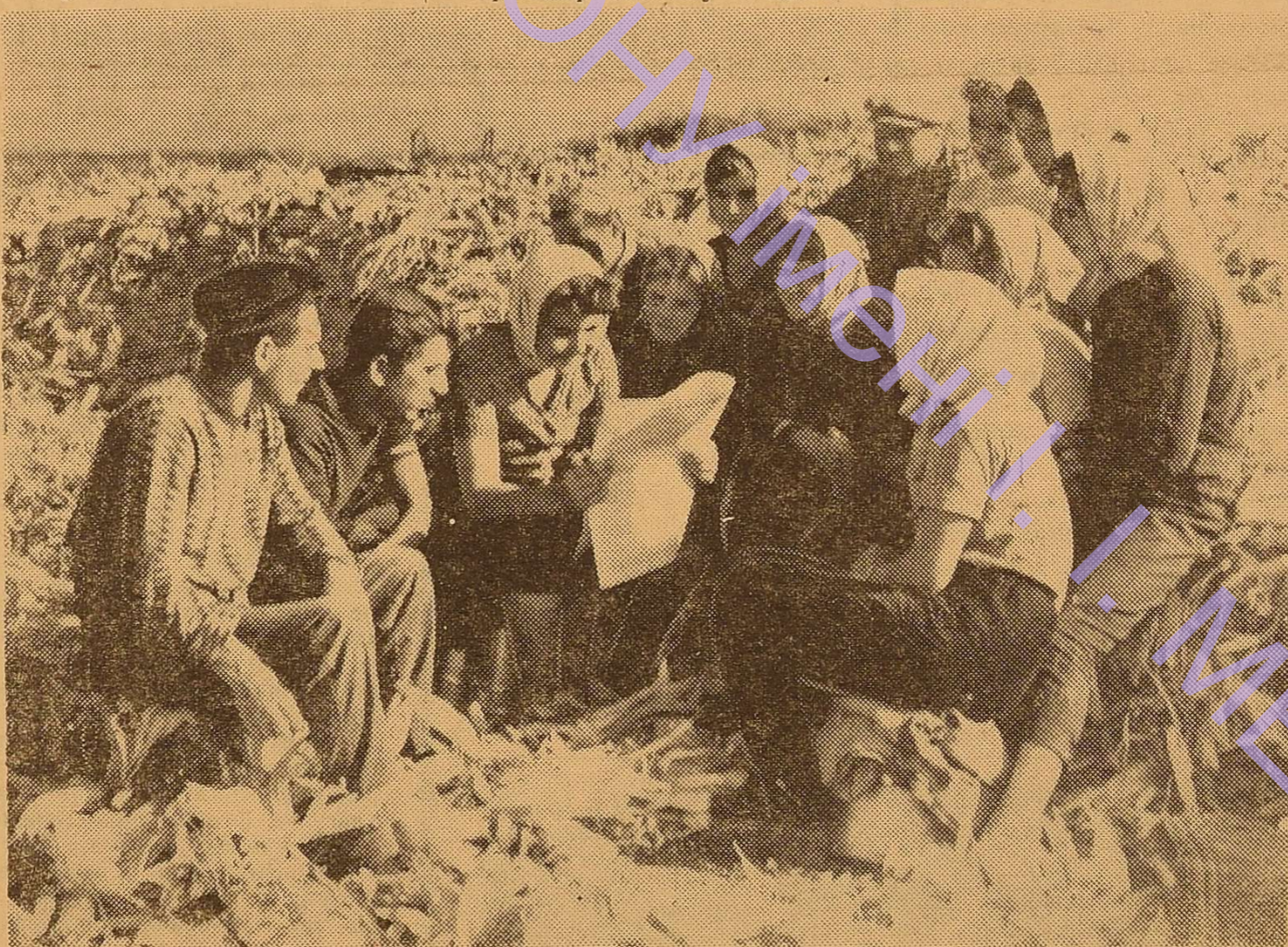
Про що пишуть в газеті?