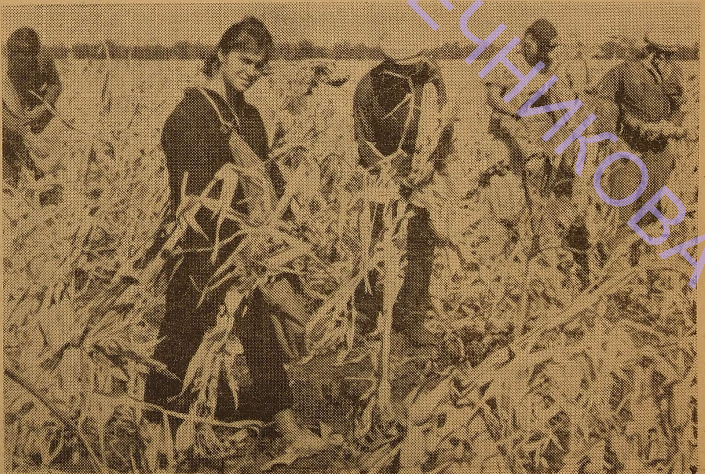
На фото: передовики I курсу біологів (с. Анастасівка).

Є. БАРЧУК, ст. I курсу хімфаку (газета «Советский химик» № 1).