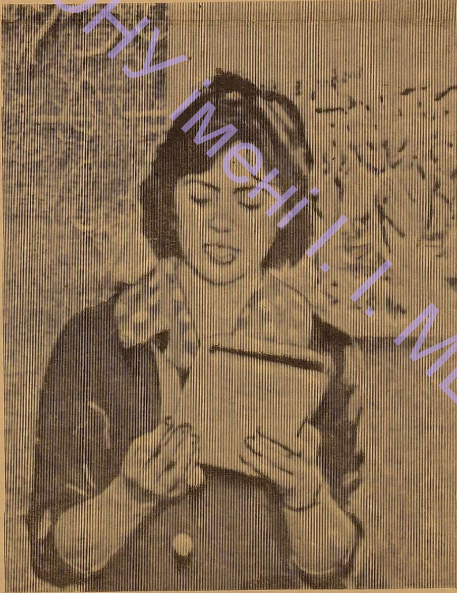
Практикантка трохи хвилюється...