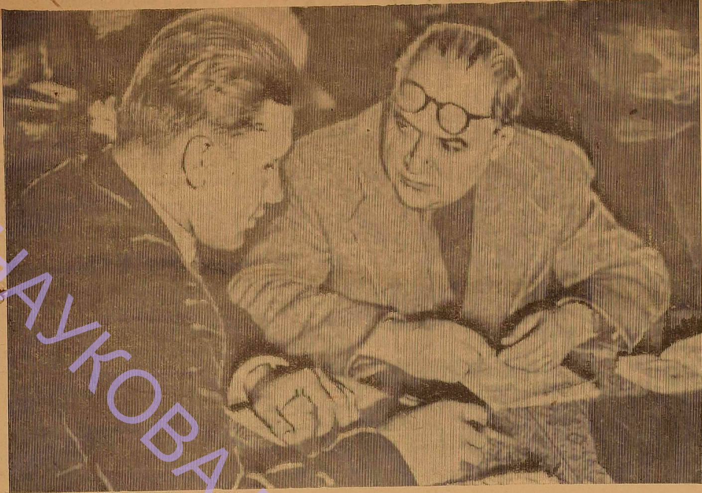
На консультації у методиста.