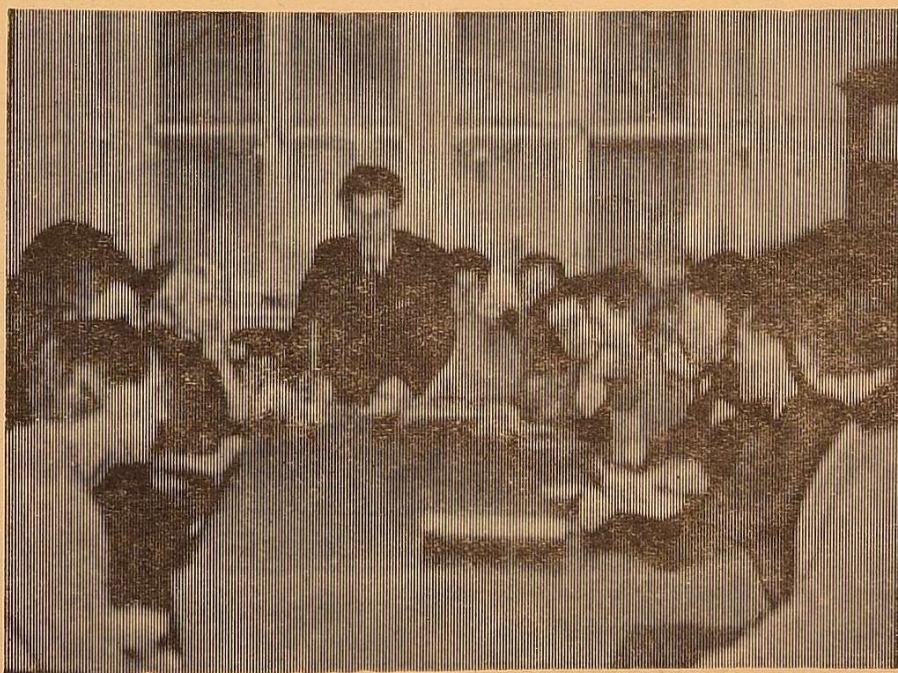
На фото: делегація польських студентів в комітеті ЛКСМУ університету.