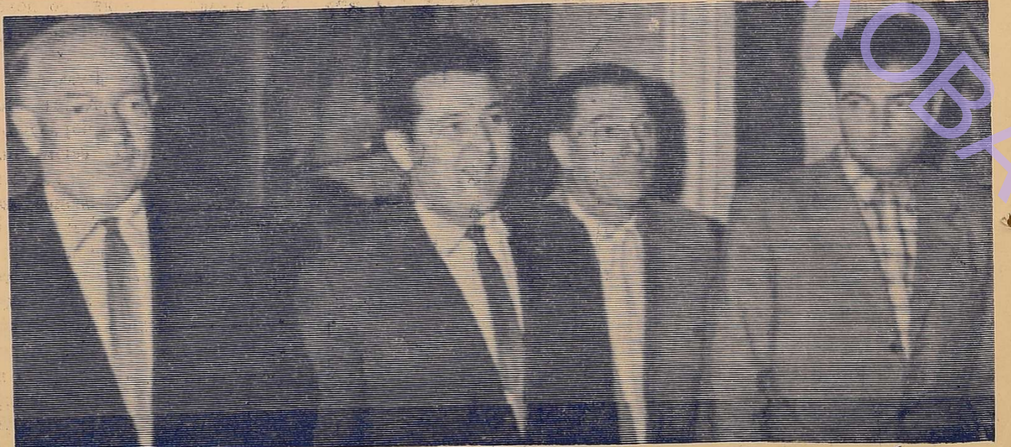
Наприкінці жовтня відбулася цікава зустріч студентів та викладачів ОДУ з групою відомих українських письменників. Зліва направо: С. Олійник, О. Гончар, В. Кондратенко, М. Сингаївський.