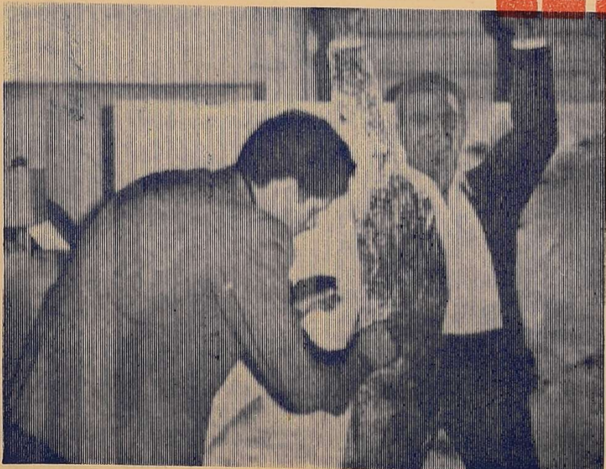
Готується святковий стенд.