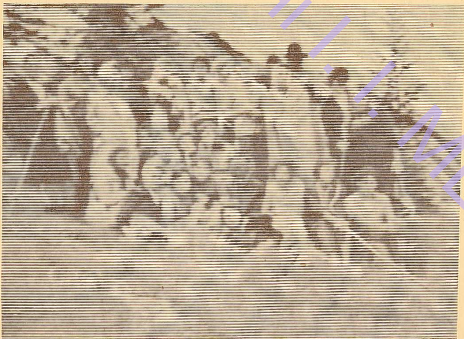
Студенти-філологи в Карпатах.

І знову стукотять колеса, ніби співаючи нескінченну пісню про все, що вони бачили на своєму шляху. А в купе сміх, пісні. Деякі сусіди по купе навіть подивлялись на нас «косо». «Скільки вже можна співати та сміятись?» — говорили їх погляди. Та ось рано-вранці ми зійшли на вокзалі в Коломию. Де ж знамениті Карпати, де сніг, що виблискує на їх вершинах? Та нас «заспокоїла» тутешня бабуся: до справжніх Карпат ще кілометрів сорок. Навіть їсти й то не хотілось. Всі горіли бажанням побачити, і не тільки побачити, але й полазити по горах. Ішли в автобусі і мріяли про те, як будемо ходити по горах ніби справжні альпіністи. За мріями і жартами не помітили, як приїхали в село з дуже цікавою назвою.