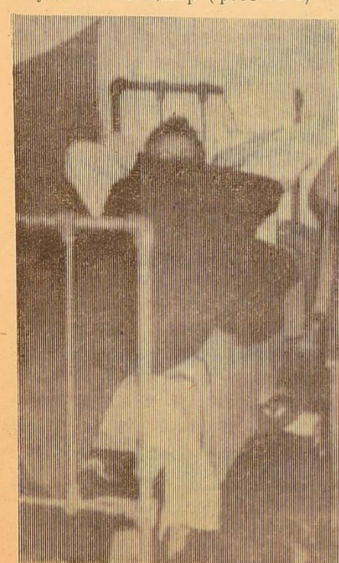
Фото № 5.

Ми у червоному кутку. Хто грає в шахи, хто дивиться телепередачу. Але найбільше розважається сам і веселить інших улюбленець студентів кіт Цезар (фото № 8).