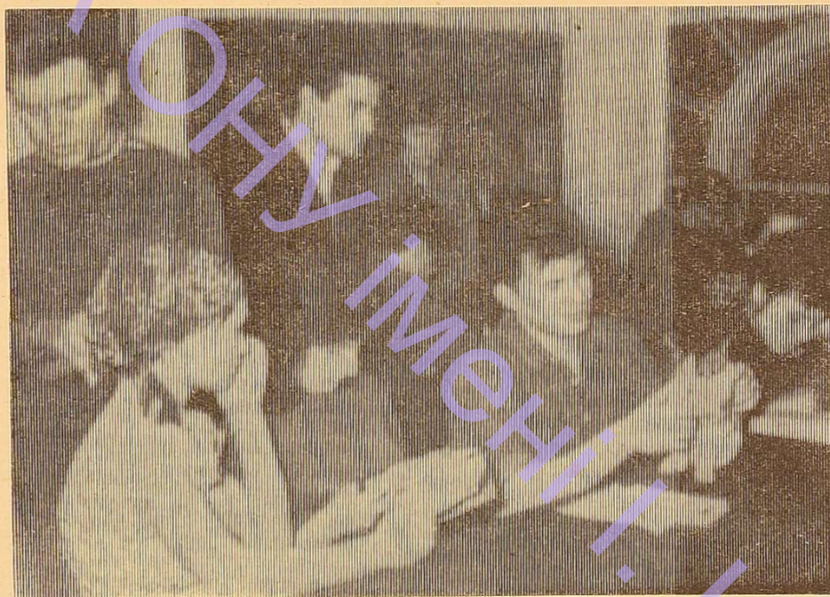
Фото № 8.

Вам смішно? Не все, звичайно. Не все, а дещо смішно. Смішно і разом з тим сумно. Сумно, тому що часто умови життя в гуртожитку залишають бажати кращого. ...але не будемо зараз говорити про умови і навіть не будемо говорити про культуру студентів. Одне лише питання хвилює: як студенти відпочивають? Чи весело їм в годину дозвілля? Чи цікаво їм при тому? Знову подивимось на тих, що сидять у червоному кутку.