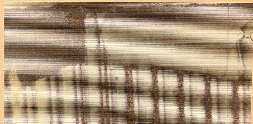
Фото № 3.