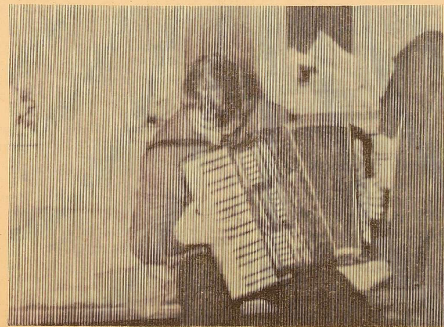
Фото № 7.

— Пусть вымерзает, — заспокоїла одна з них.