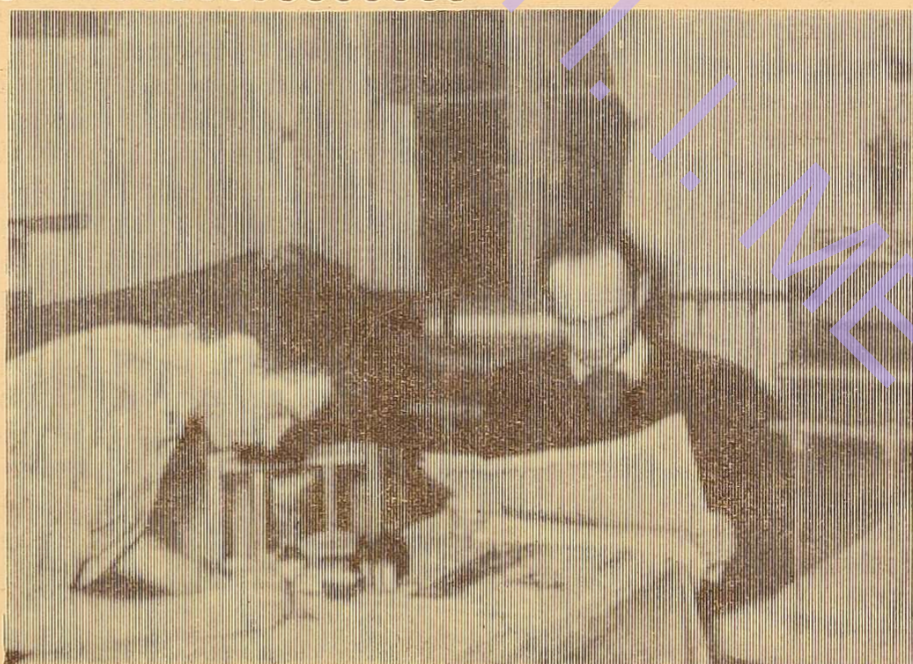
Фото № 1.

Погожий весняний вечір... Нас троє... Куди б піти? Чим зайнятися? Трапилося так, що на сьогодні ми для себе не підготували ніяких розваг. Що ж, подивимось, як розважаються інші. І ось ми у гуртожитку по вулиці Островидова.