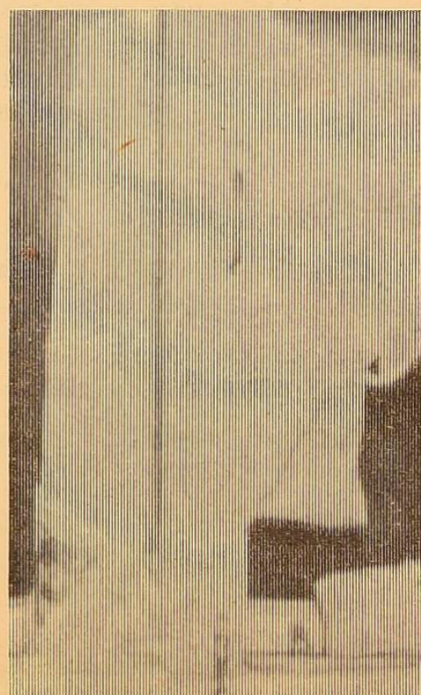
Фото № 9.

Рейдова бригада «ЗНК».