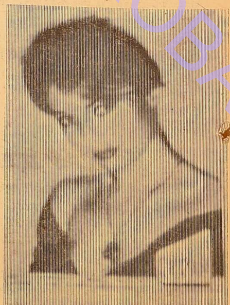
Фото № 4.

— Она осталась здесь с прошлого года, — коментує нам один із