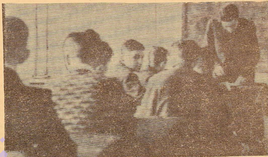
На першому уроці

«В школі у мене все йде добре. Робота подобається. Мене призначили класним керівником у 7-му класі, у тому самому класі, який завдав мені багато клопотів. Гурток англійської мови для учнів працює регулярно, два рази на тиждень. Ми випустили стінну газету «Піонер» англійською мовою. Зараз готуємося до вечора. Він буде на початку квітня, діти готують пісні і вірші англійською мовою. Гурток англійської мови для учителів я веду один раз на тиждень. Учні цікавляться англійською мовою. Не вони винні в тому, що відстали. І я намагаюся по мірі можливостей збагатити їх знання з англійської мови».