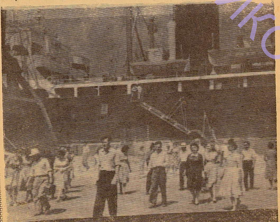
Повертаємось з судна.