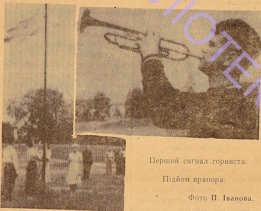
Перший сигнал горниста.