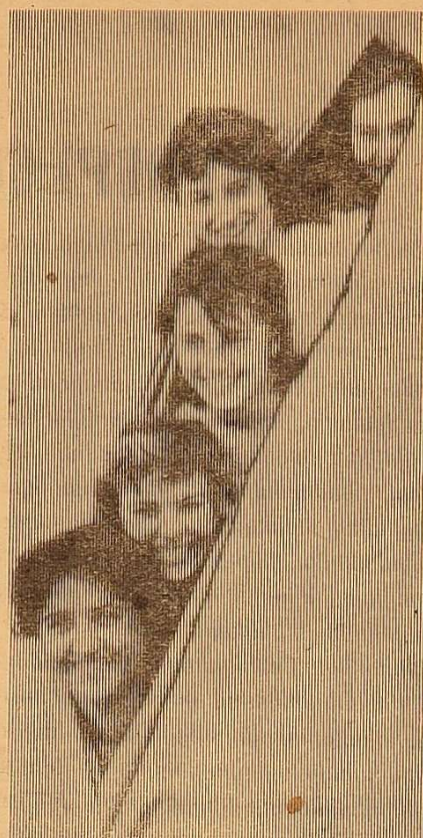
У цієї палатки — нещасливий номер (13). А що ви скажете про обличчя її мешканців?