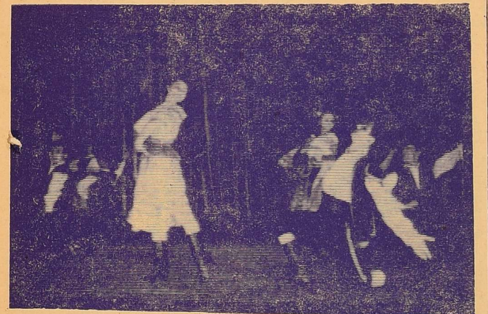
Фінал угорського танцю.

Зразу ж завоював симпатію глядачів танцювальний колектив.