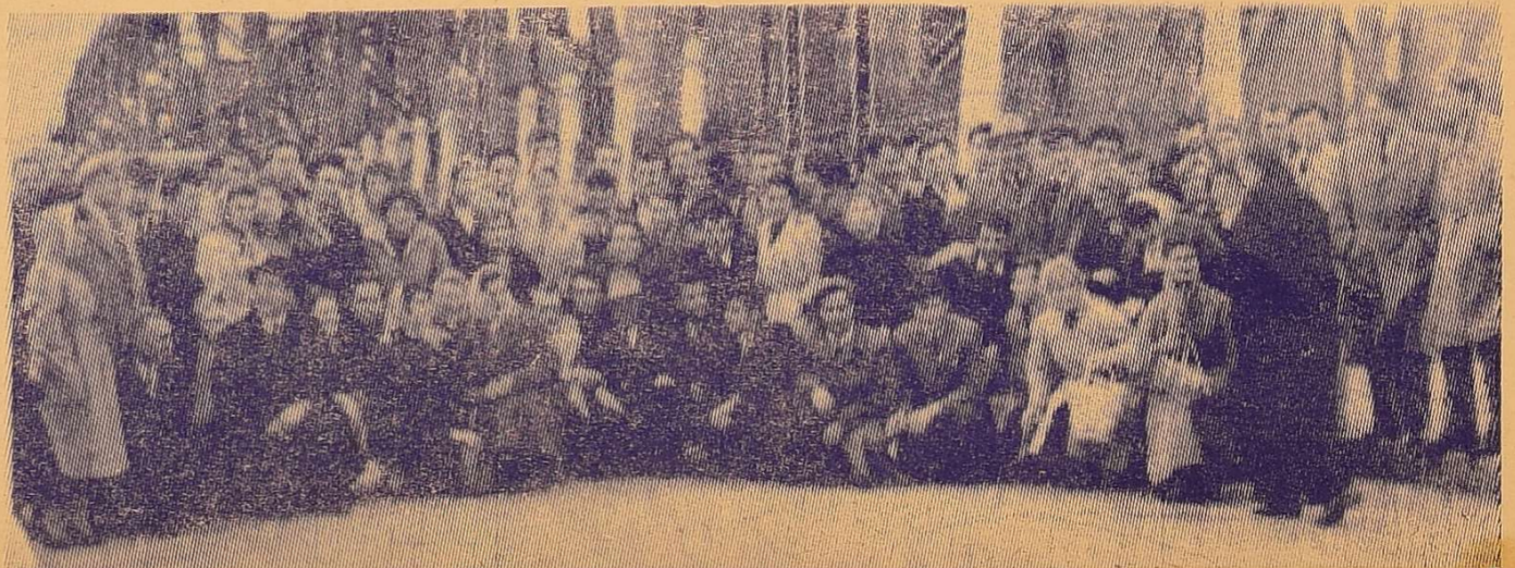
Ми в Дубоссарах.

На сцені — ансамбль бандуристів. Ми вже непогано знаємо цей колектив і тому прислуховуємось до думки кишинівців. Вони приємно здивовані: «Так багато ви-