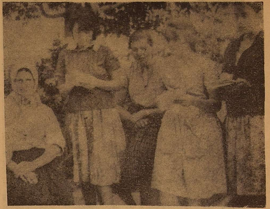
Ми і наші «об'єкти».

В літературній мові маємо мішок, лісок, біда, відро, припічок тощо. Тут же замість ненаголошеного і з « ять » чітко звучить е : меіок, лесок, ведро, причепок . Місцеві вчителі ілюстрували це явище в словосполученні, вихопленому, певно, з живого мовлення — « берегом з ведром по песку ». Очевидно, така діалектна фонетична риса їх особливо бентежила.