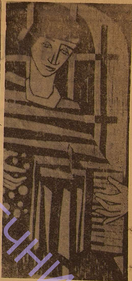
О. Вент Думойс. «Музикант».

Хорхе Риголь і Гонсалес Іглесіас — художники великої обдаро-