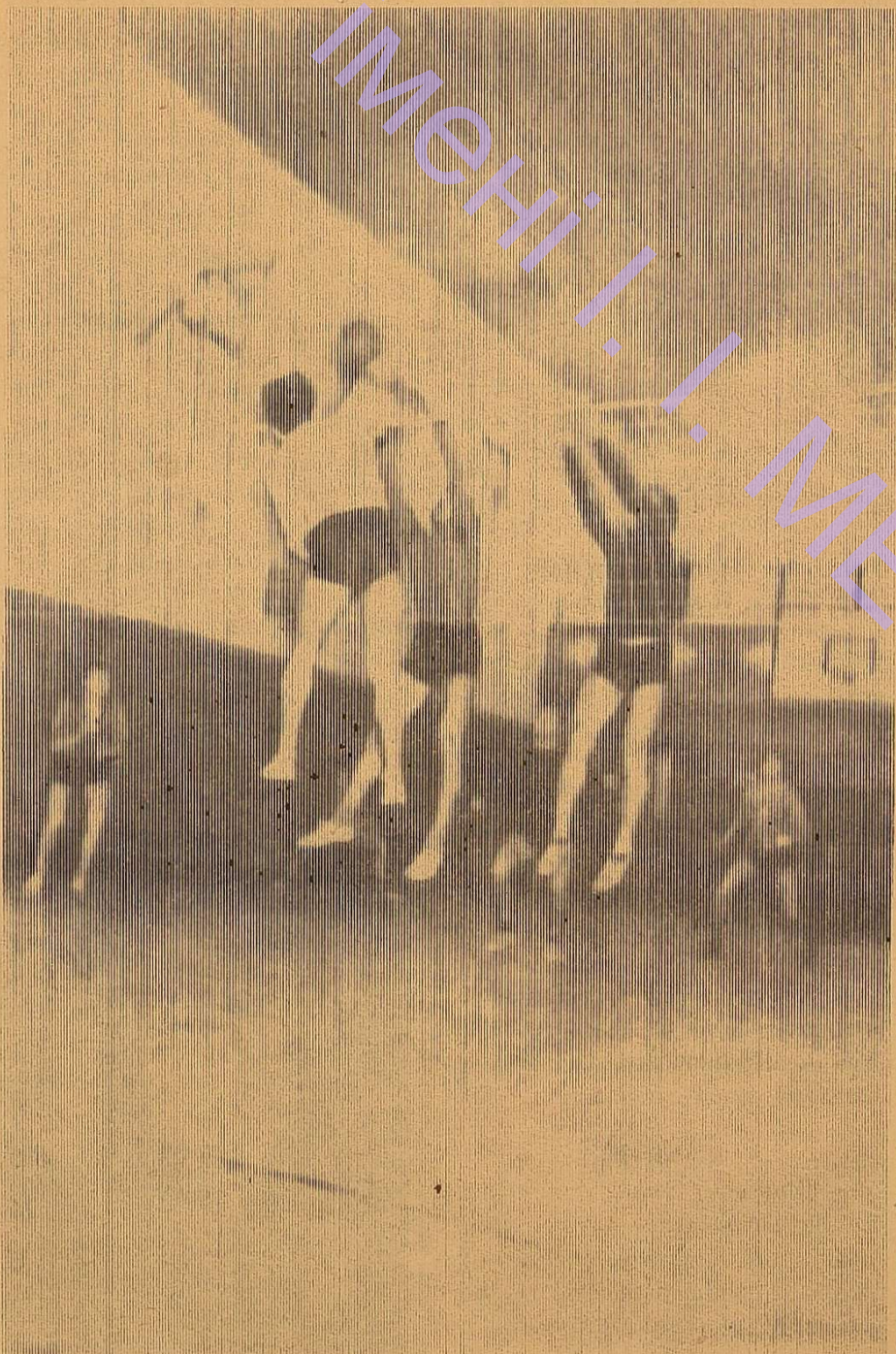
Закінчуються міжфакультетські змагання з волейбола. Лідери визначились ще після перших турів. Це фізики, географи і філологи. На фото: зустріч між командами філфаку і геофаку.