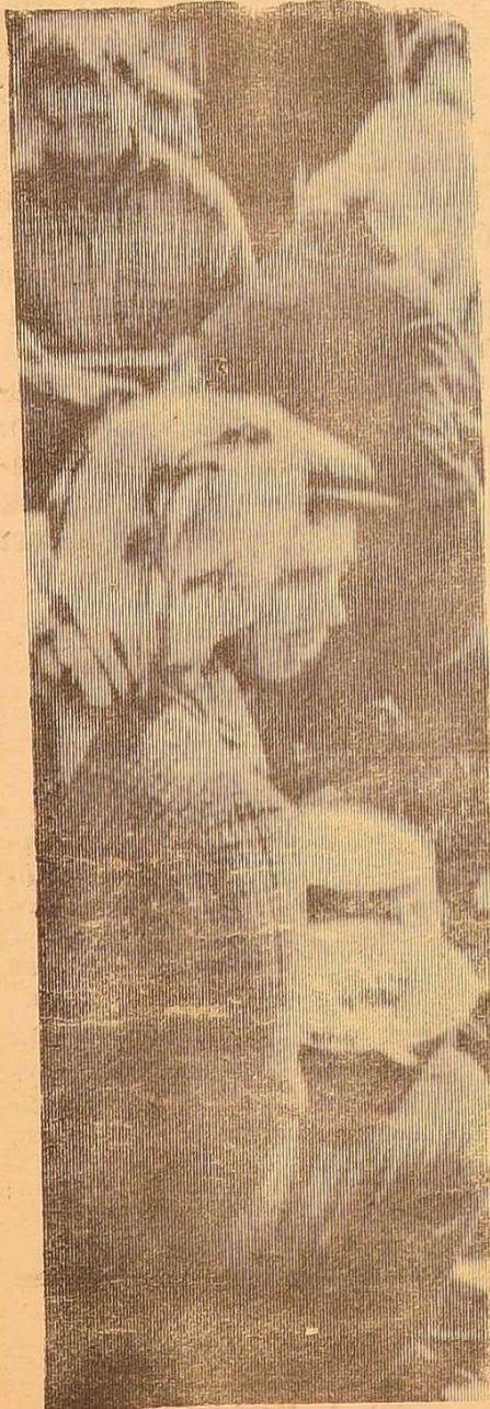
Обідня перерва на полі.

7. Студентів 3 курсу хімічного факультету Прима, Гулая, Столярову .