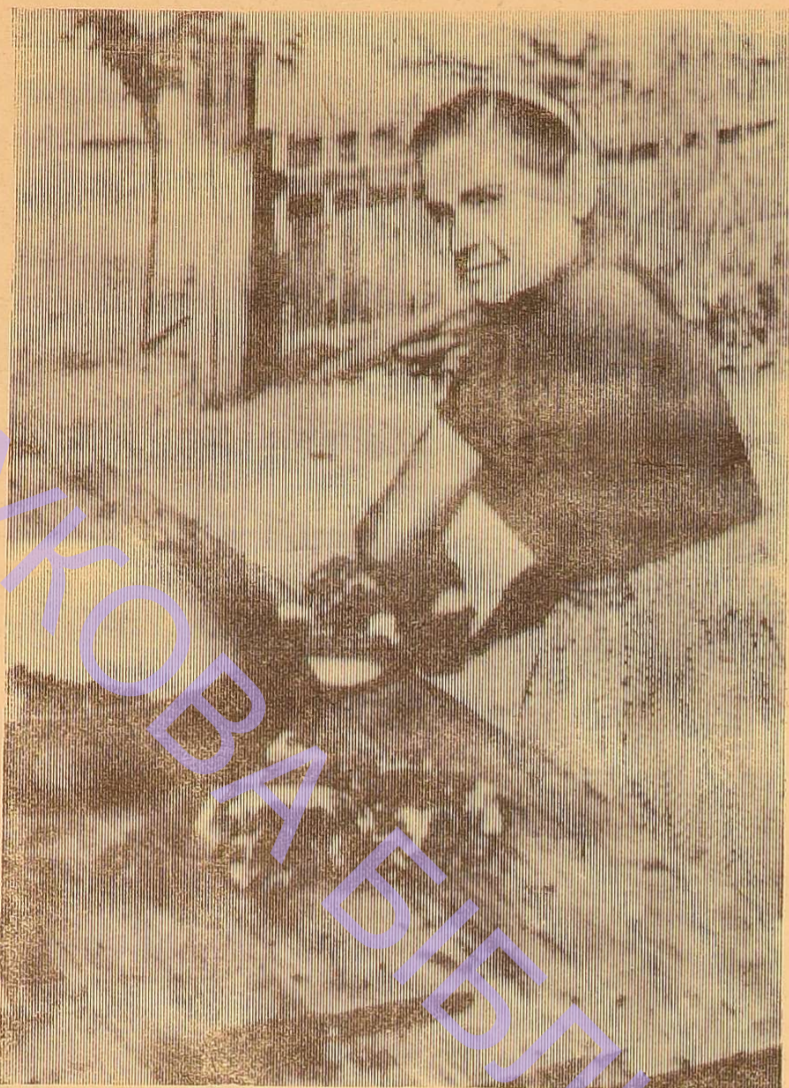
Хороша куховарка у хіміків—першокурсників.