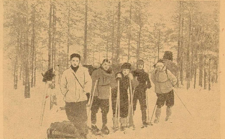
Важкі рюкзаки! Треба хвилину перепочити.

валянки. Засніжені поля, лісозахисні полоси. Відчуваєш дихання півночі.