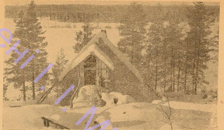
Хоч хатинка і «курна», манить лижника вона.

Казково прекрасний зимовий ліс! Мимоволі замилуєшся.