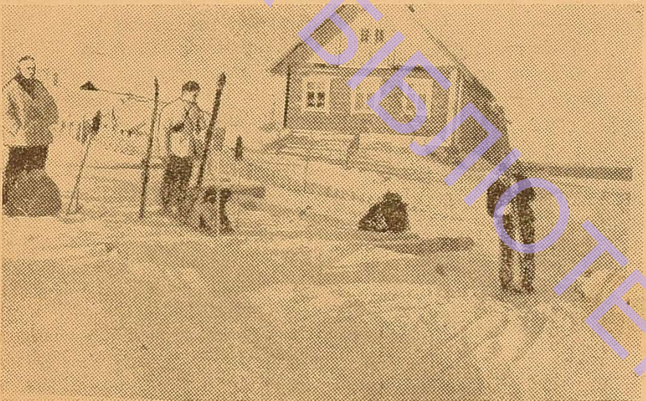
Готуються в похід — змащуй краще лижі.

М. І. САВЧЕНКО , учасник туристського походу по Карелії, старший викладач геолого-географічного факультету.