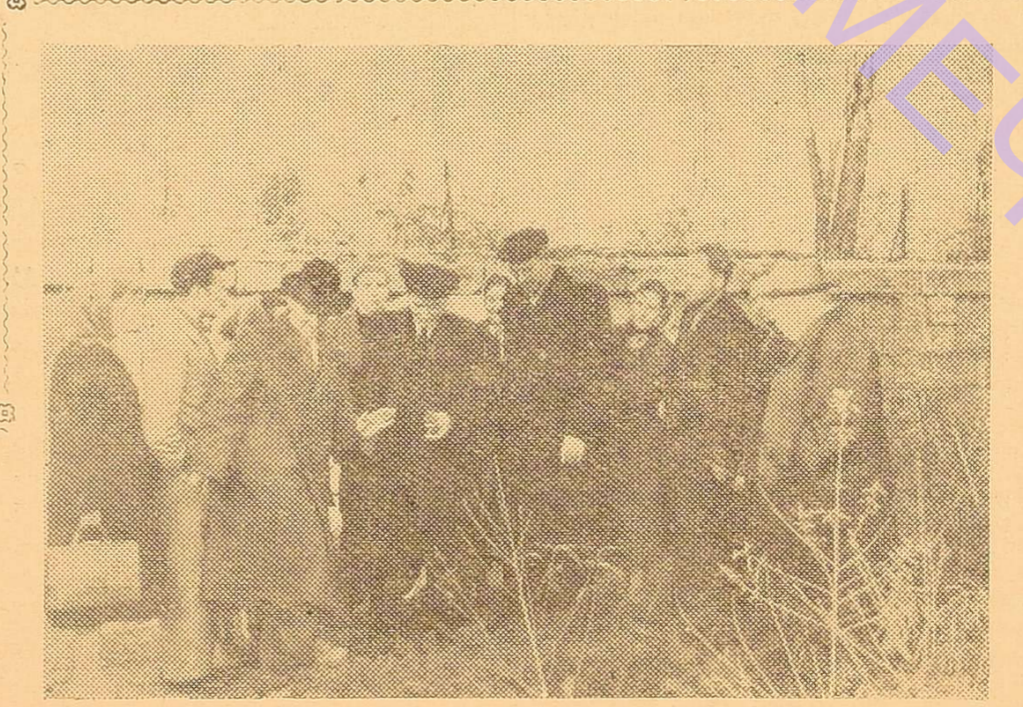
На фото: академік Т. Д. Лисенко (в центрі) серед викладачів та студентів біофаку.

Т. Д. Лисенко ознайомився з досліддами кафедри генетики і дарвінізму. Особливий інтерес і увагу викликали у академіка дослідження доцента І. М. Сагайдака. З великою увагою оглянув він помідори з подвійною кореневою системою, великі коренеплоди цукрових буряків з прищепленою кореневою системою столових, дво-