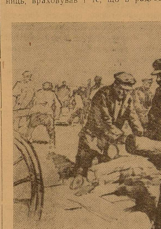
На фото: В. І. Ленін на першому комуністичному суботнику.

«Коли В. І. Ленін довідався, що Ф. Е. Дзержинський допрацювався до крохокаркани і не хоче відпочивати, він подзвонив мені і запропонував прийняти рішення ЦК про те, що Дзержинському пропонується піти на два тижні у відпустку в Наро-Фомінськ. Тоді в Наро-Фомінському був найкращий під Москвою радгосп, і Дзержинський міг одержати там хороше харчування. Володимир Ілліч, який продумав все до дрібниць, враховував і те, що в радгос-